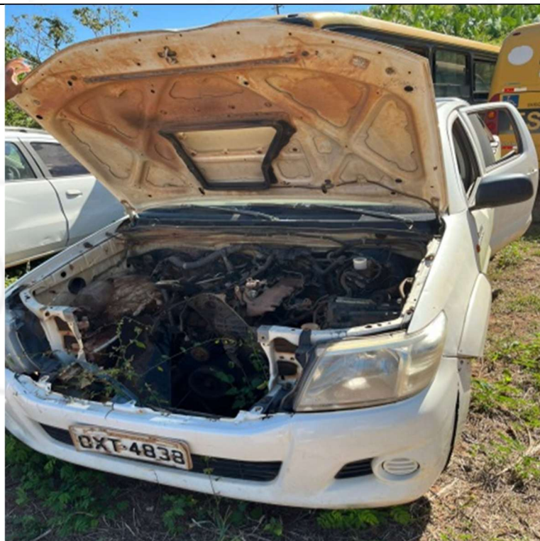
Figura 2 – Compartimento do motor (ausente)