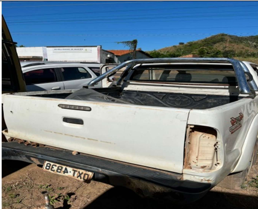
Figura 3 – Vista traseira (ausência de lanternas e desgastes visíveis)