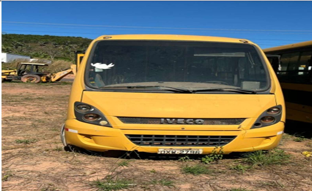
Figura 1 – Vista frontal do veículo