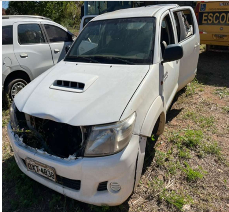
Figura 1 – Vista frontal do veículo