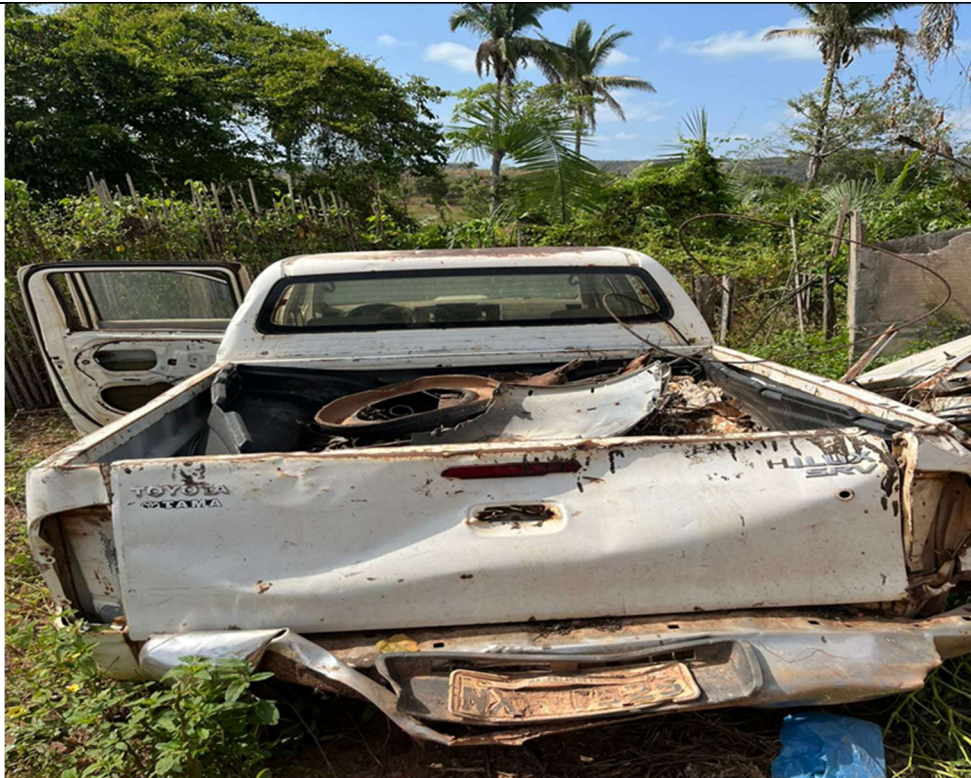
Figura 3 – Vista traseira (ausência de lanternas e desgastes visíveis)