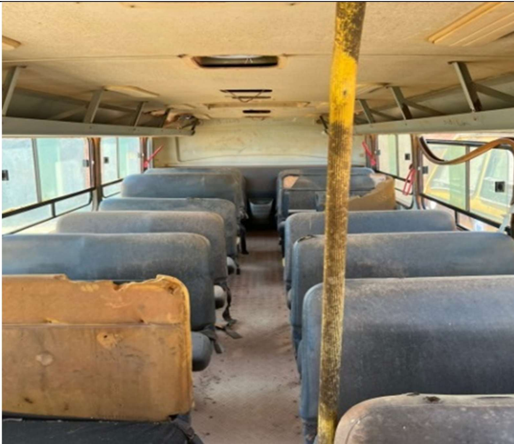
Figura 4 – Interior do veículo (bancos danificados)