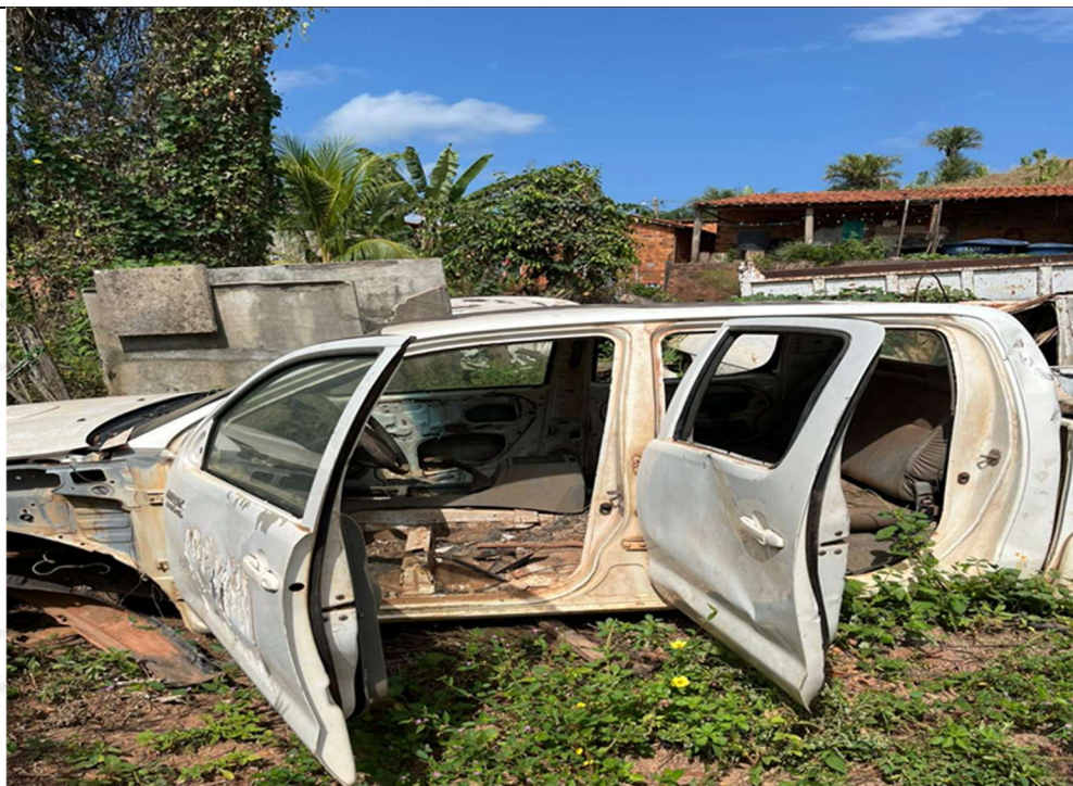
Figura 2 – Compartimento lateral do veículo