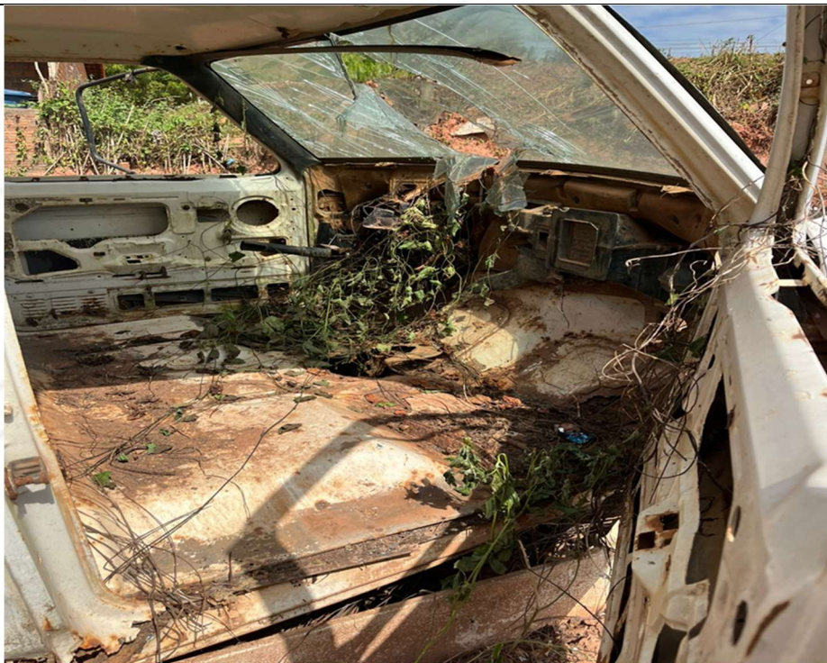
Figura 4 – Interior do veículo (ausência de bancos e painel deteriorado)