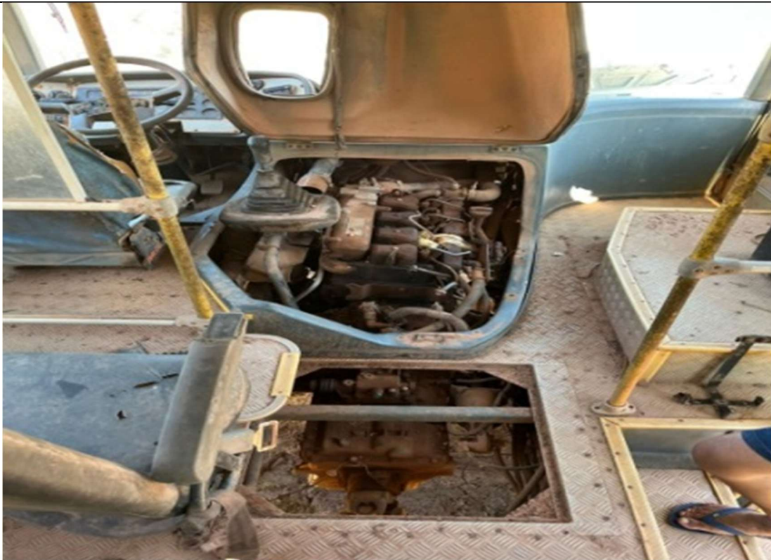
Figura 5 – Interior do veículo (Painel danificado e caixa de marchas com defeitos)