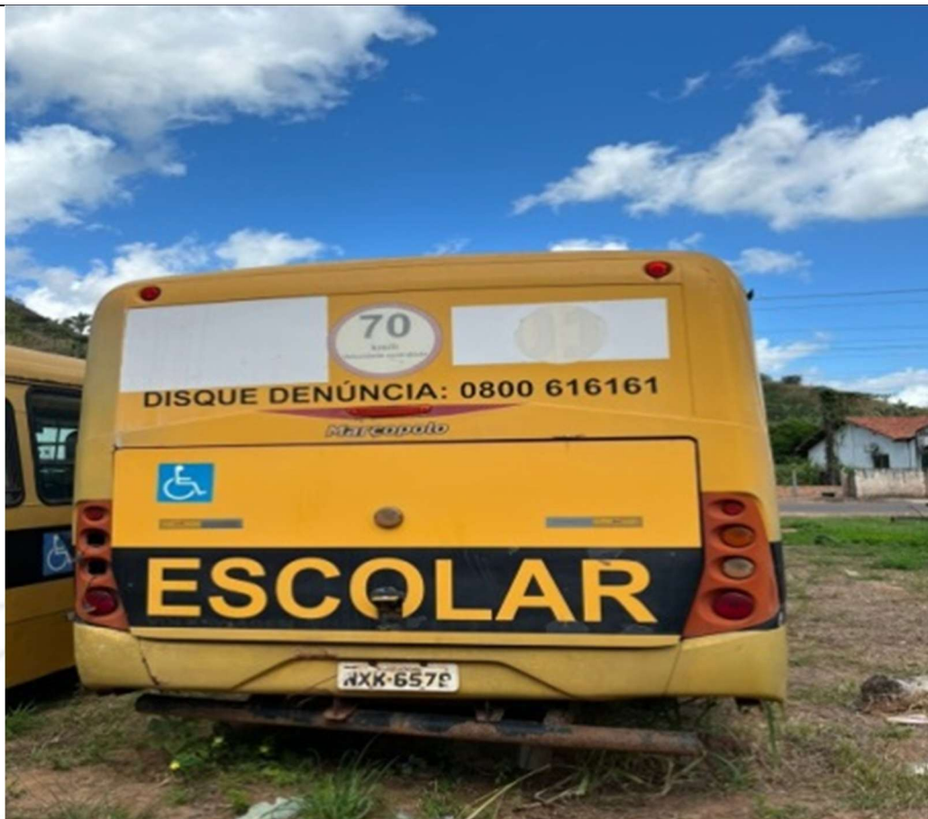
Figura 3 – Vista traseira