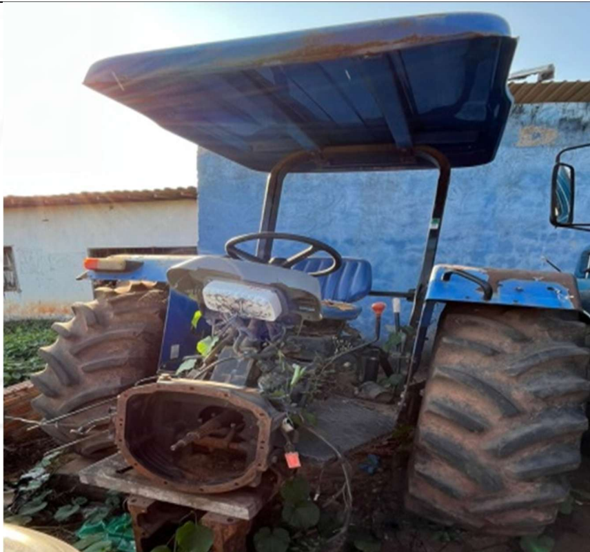
Figura 1 – Vista frontal do veículo