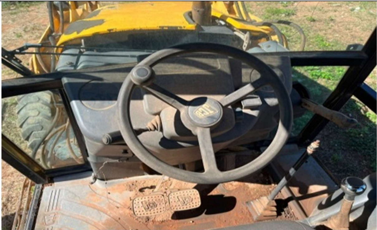
Figura 4 – Interior do veículo