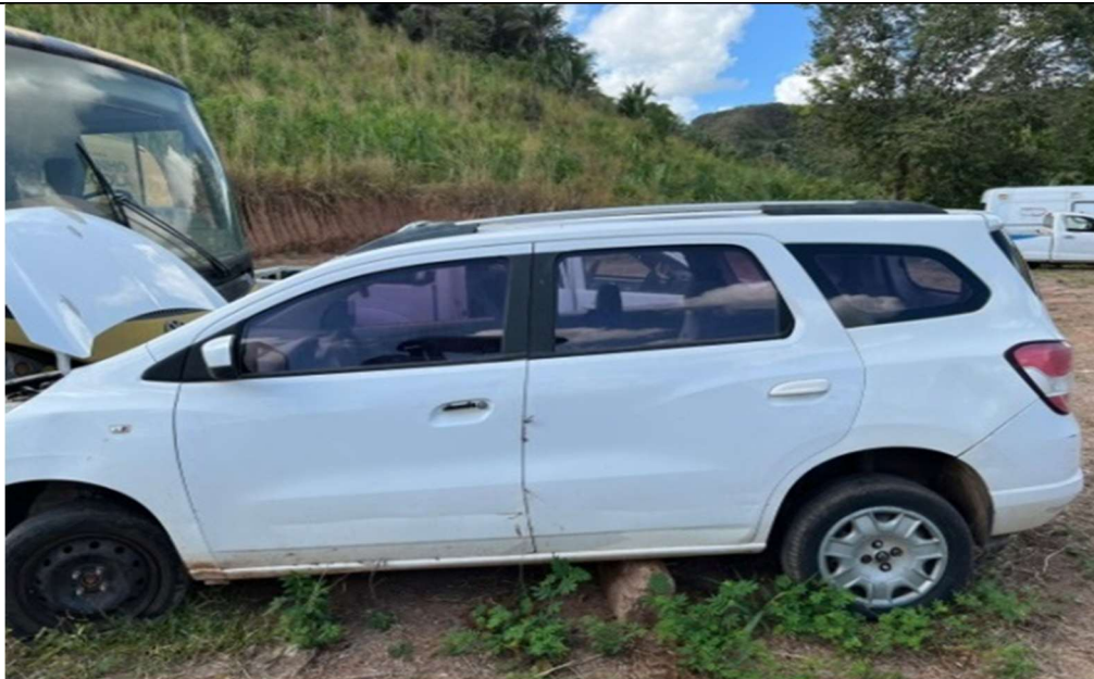
Figura 2 – Compartimento lateral