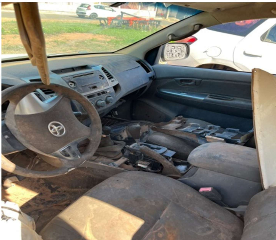
Figura 4 – Interior do veículo (bancos danificados e painel deteriorado)