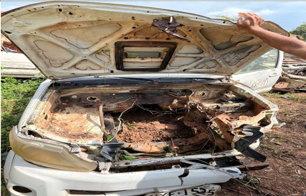
Figura 1 – Vista frontal do veículo