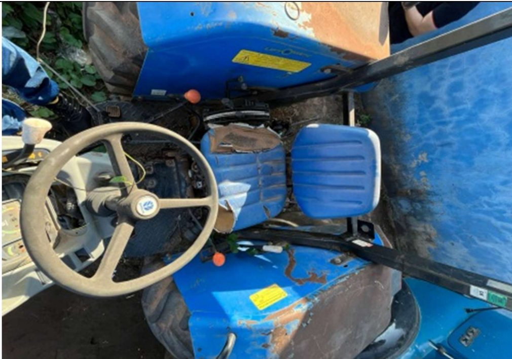
Figura 4 – Interior do veículo