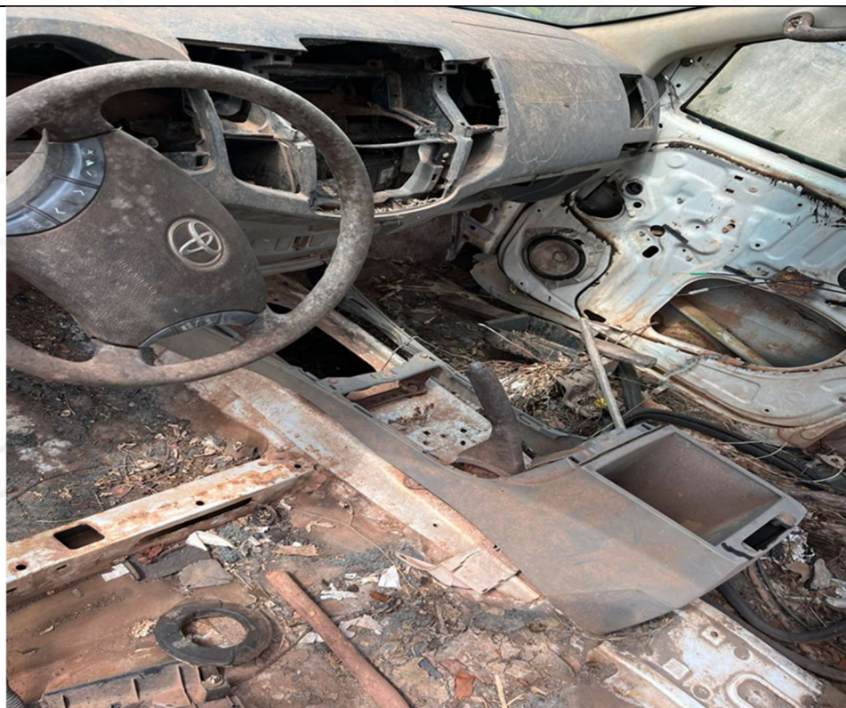
Figura 4 – Interior do veículo (ausência de bancos e painel deteriorado)