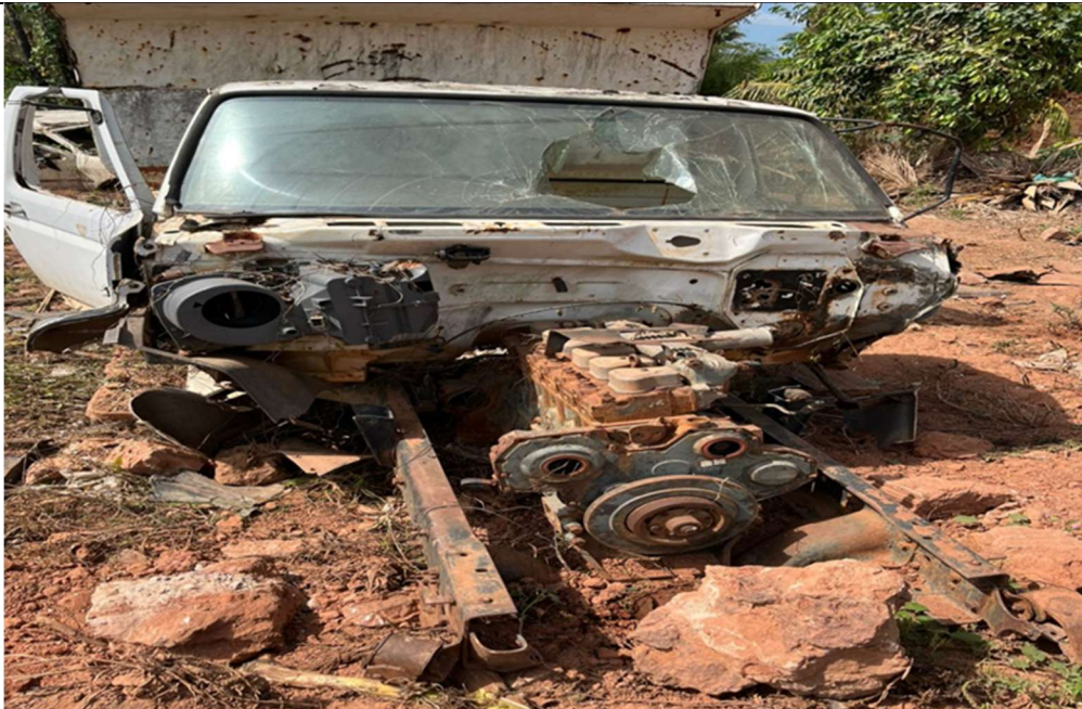
Figura 1 – Vista frontal do veículo