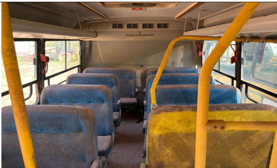
Figura 4 – Interior do veículo (bancos danificados)