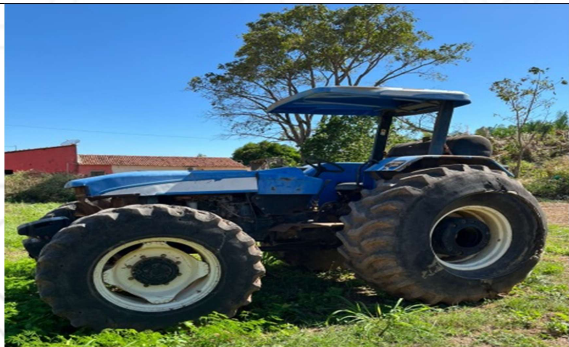
Figura 2 – Compartimento lateral