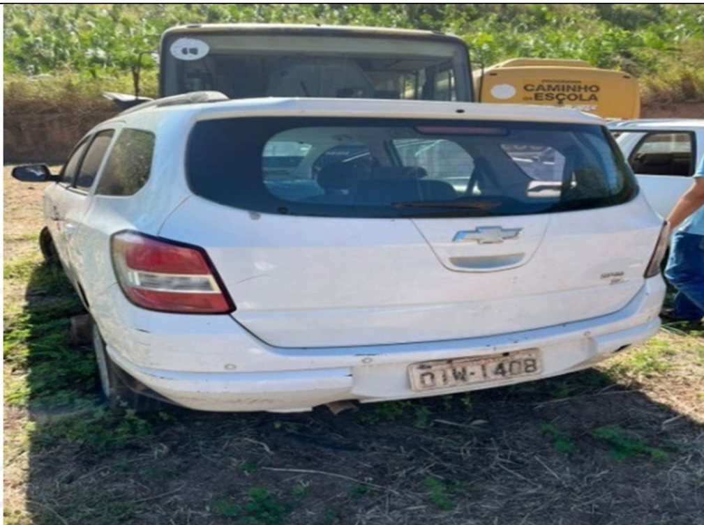
Figura 3 – Vista traseira