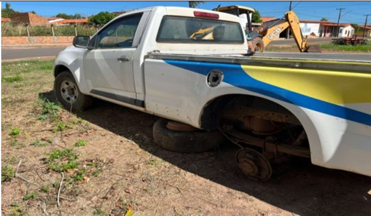
Figura 2 – Compartimento lateral (sem os dois pneus traseiros)