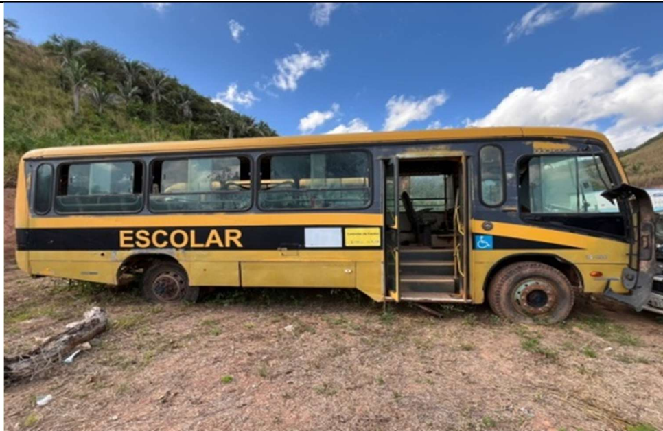
Figura 2 – Compartimento lateral