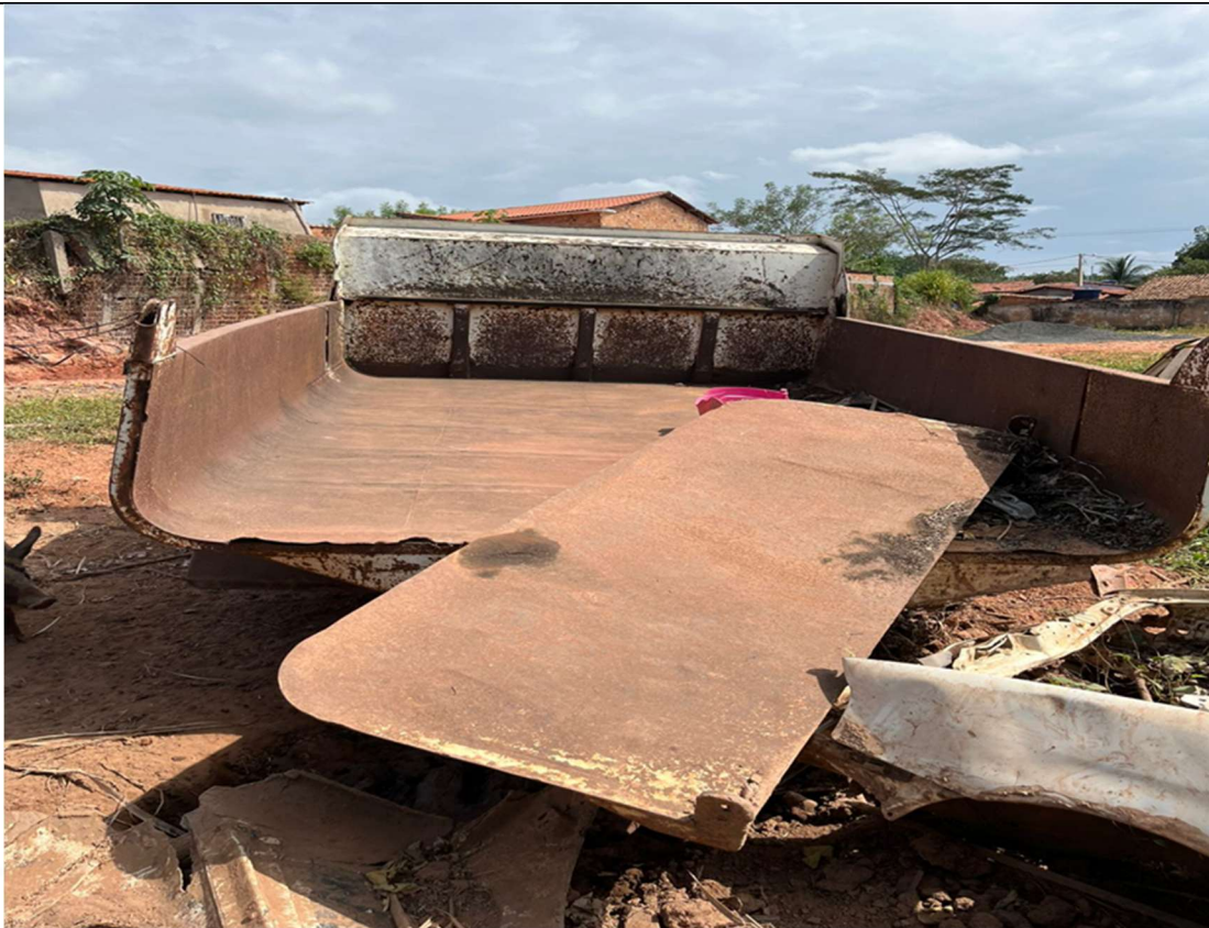
Figura 3 – Vista traseira (ausência de lanternas e desgastes visíveis)