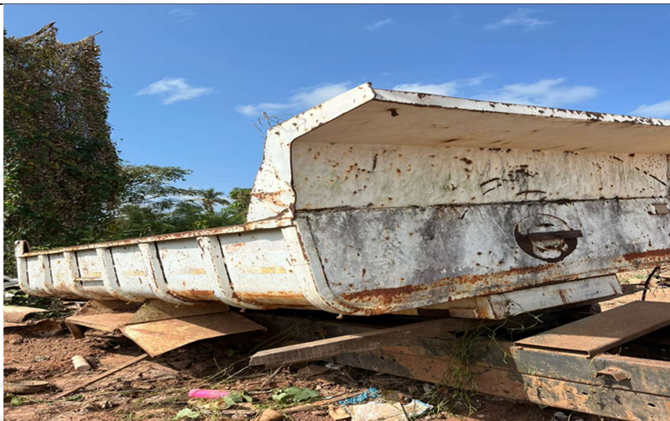
Figura 2 – Compartimento lateral do veículo