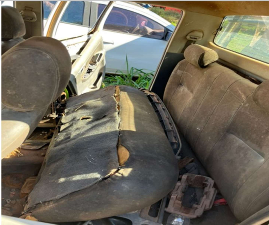
Figura 5 – Detalhes interna bancos traseiros

06.202.808/0001-38 Rua Manoel Máximo, nº49, Centro Poção de Pedras - MA