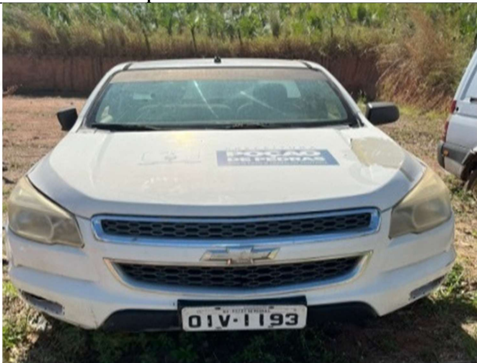
Figura 1 – Vista frontal do veículo