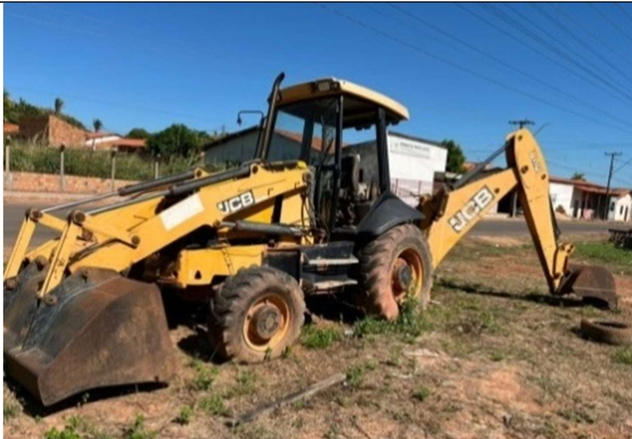
Figura 2 – Compartimento lateral