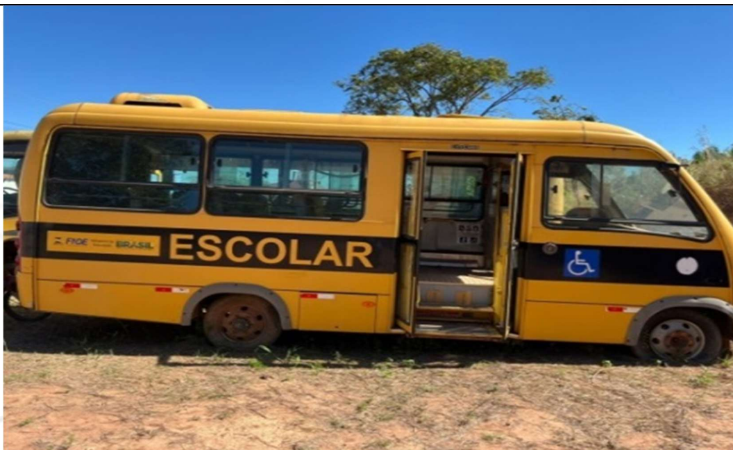
Figura 2 – Compartimento lateral