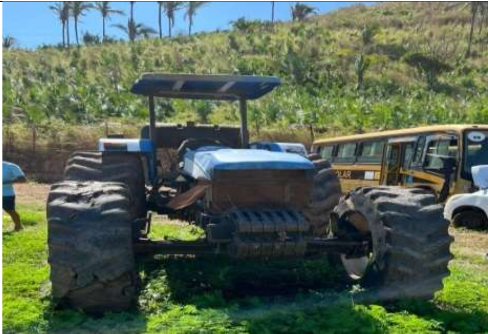
Figura 1 – Vista frontal do veículo