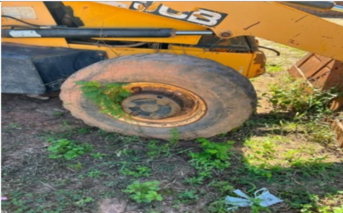
Figura 5 – Vista lateral dos pneus