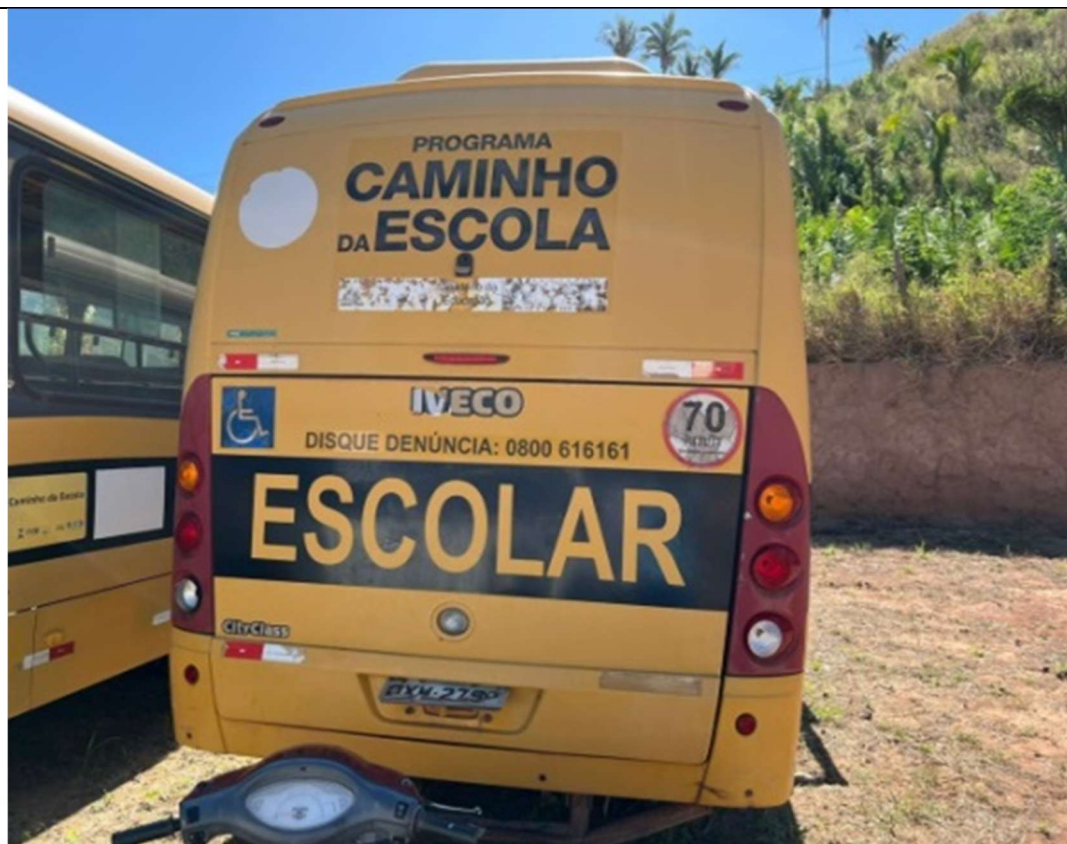
Figura 3 – Vista traseira