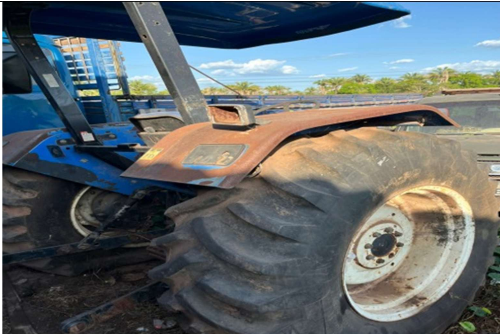
Figura 2 – Compartimento lateral