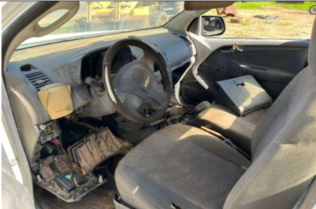
Figura 4 – Interior do veículo (bancos danificados e painel deteriorado)