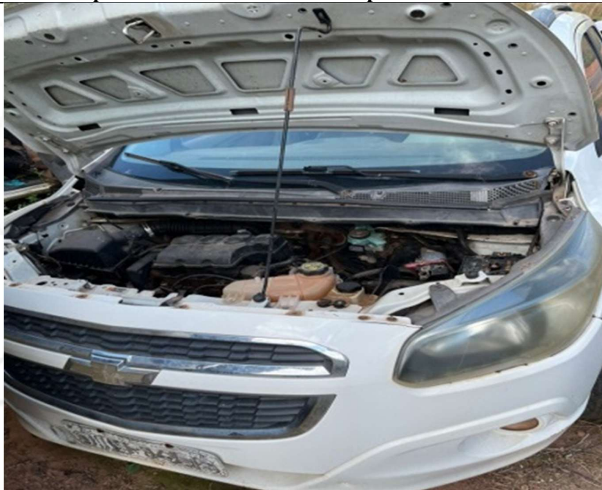
Figura 1 – Vista frontal do veículo (com motor)