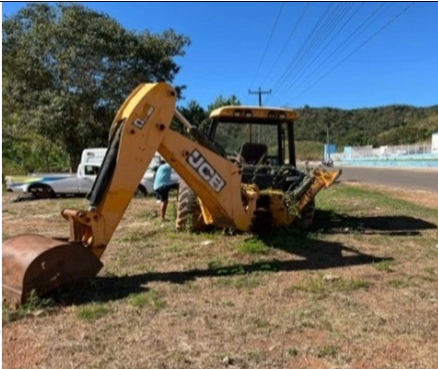
Figura 3 – Vista traseira