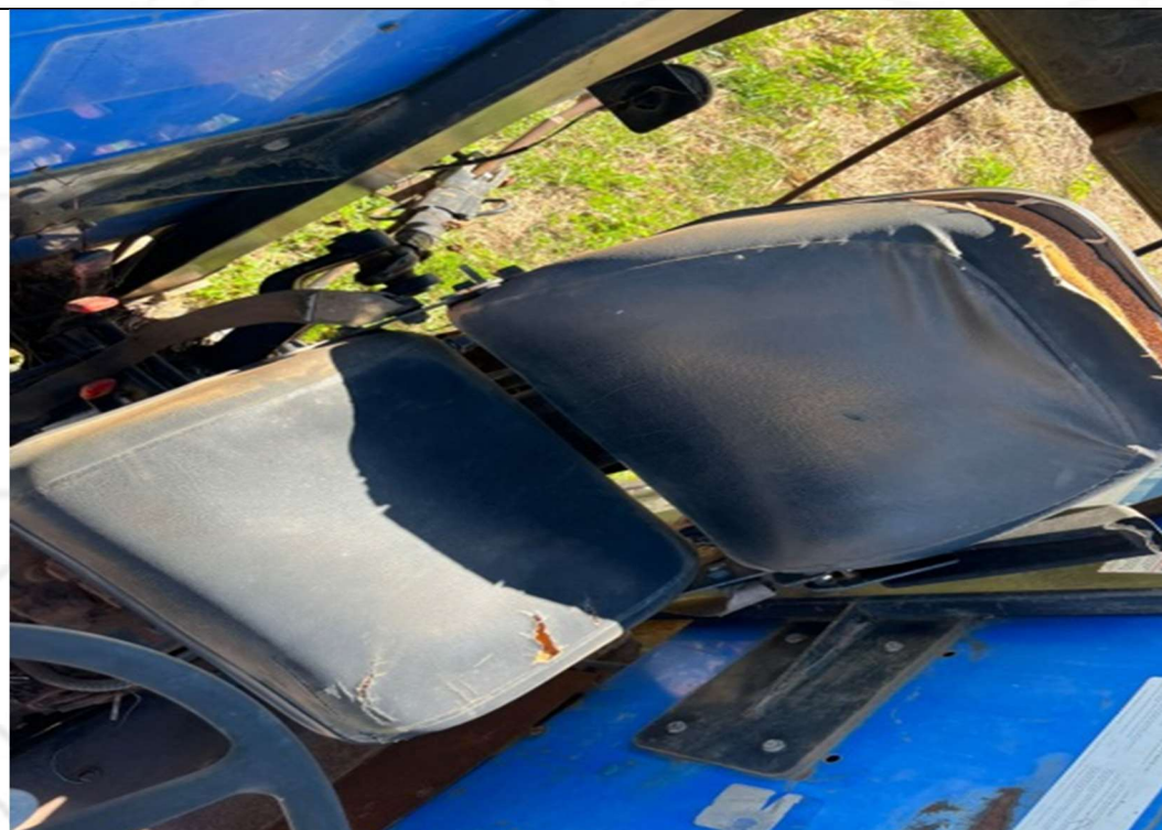
Figura 4 – Interior do veículo