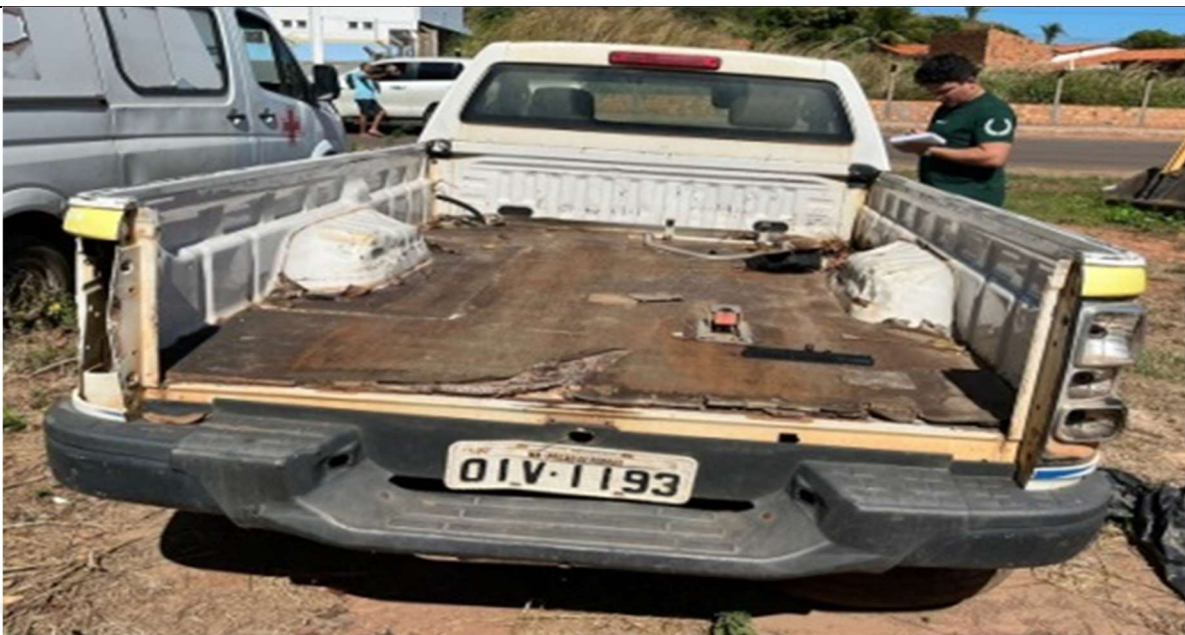
Figura 3 – Vista traseira (ausência de lanternas e desgastes visíveis)