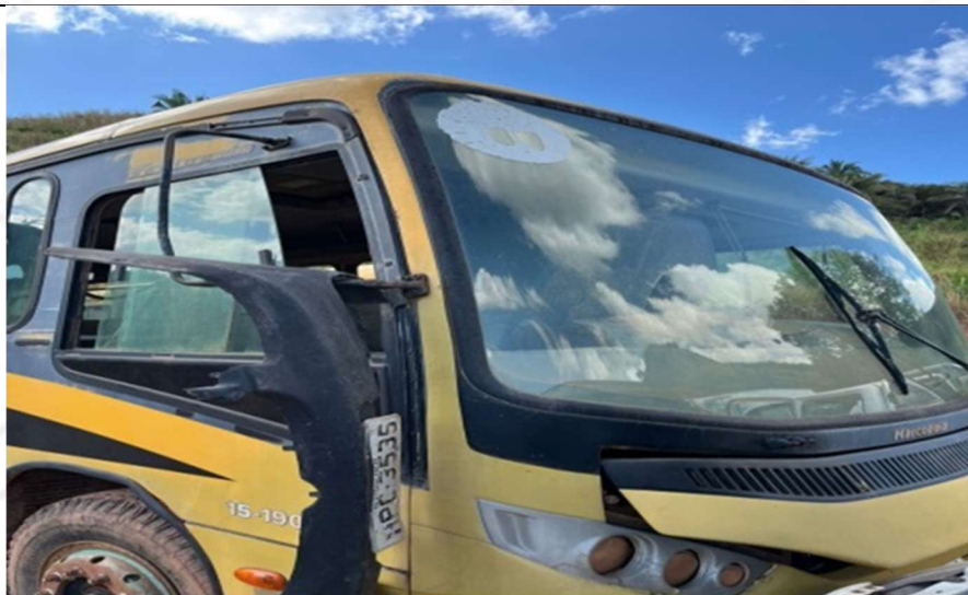
Figura 1 – Vista frontal do veículo