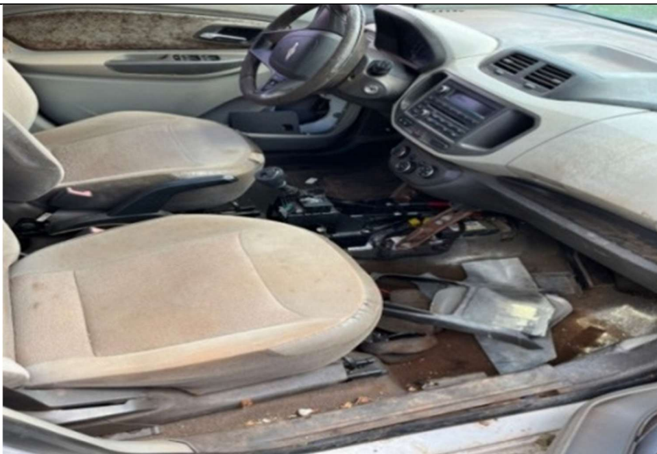
Figura 4 – Interior do veículo (bancos danificados e painel deteriorado)