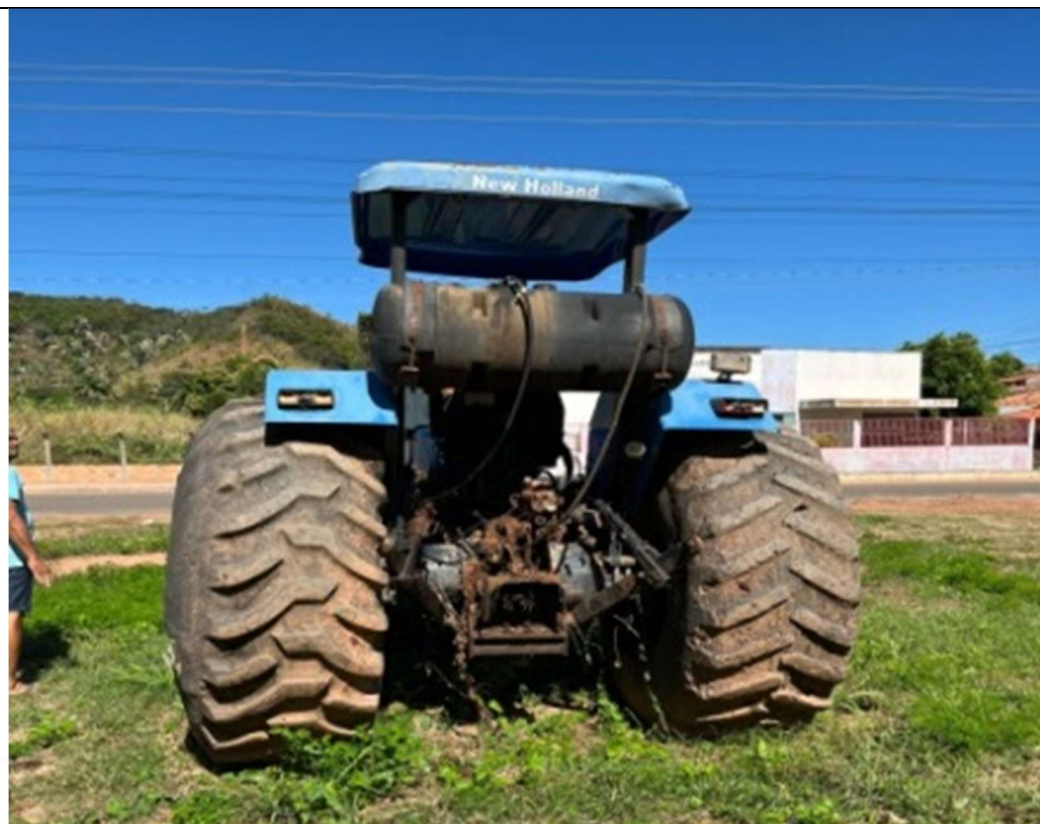
Figura 3 – Vista traseira