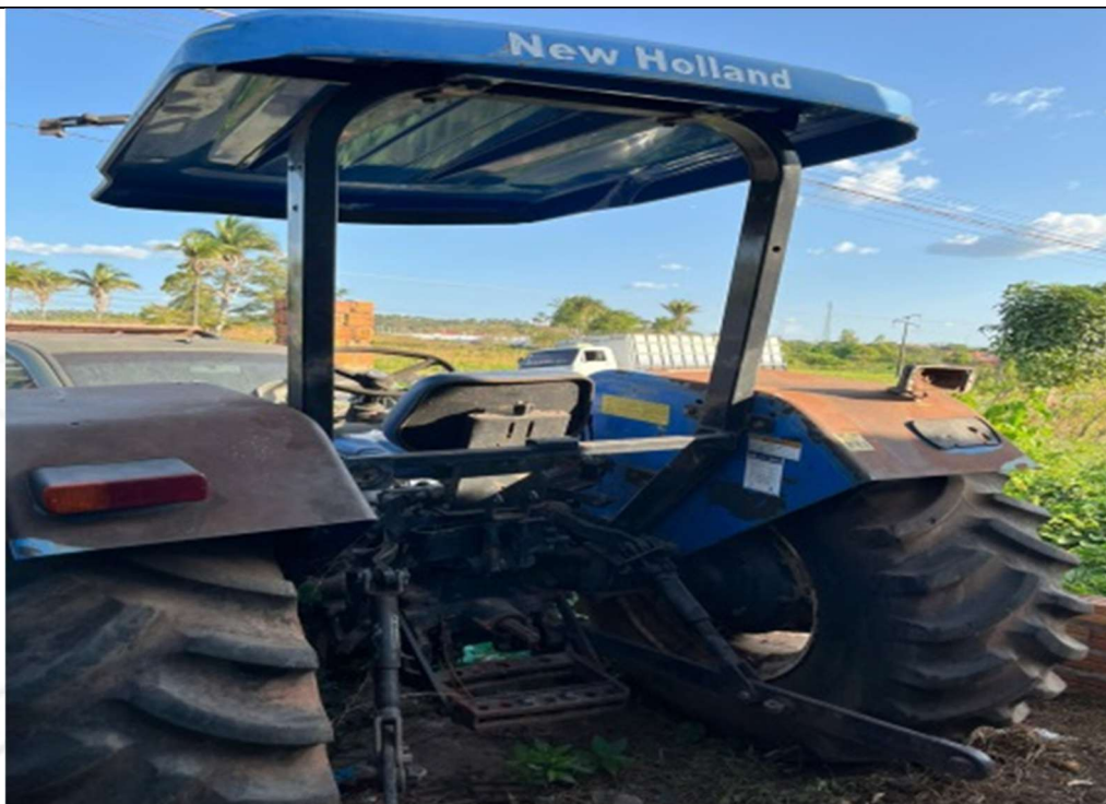
Figura 3 – Vista traseira