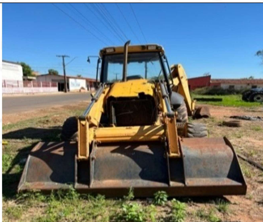
Figura 1 – Vista frontal do veículo