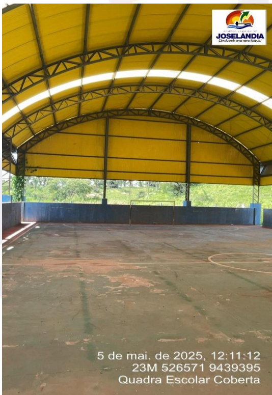
Foto 1- Piso com burcos

Este laudo fotográfico tem por objetivo registrar as condições atuais da quadra poliesportiva, documentando suas características, estado de conservação, eventuais danos ou necessidades de manutenção, visando comprovar a situação na data da vistoria.