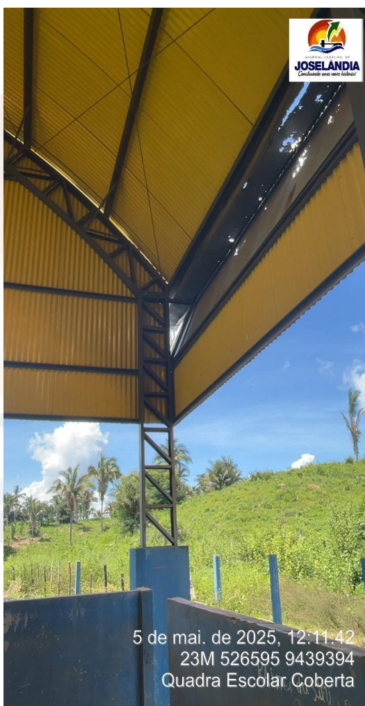
Foto 8 - Calhas obstruídas e com furos

JOSELÂNDIA Construindo uma nova história!