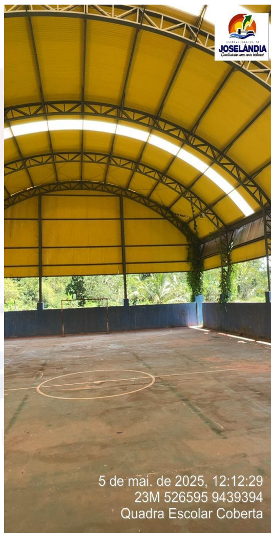
Foto 6 - Marcações da quadra praticamente inexistentes.