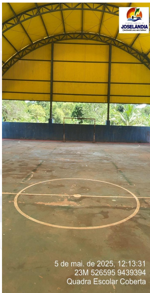
Foto 4 - Piso com fissuras, buracos.

JOSELÂNDIA Construindo uma nova história!