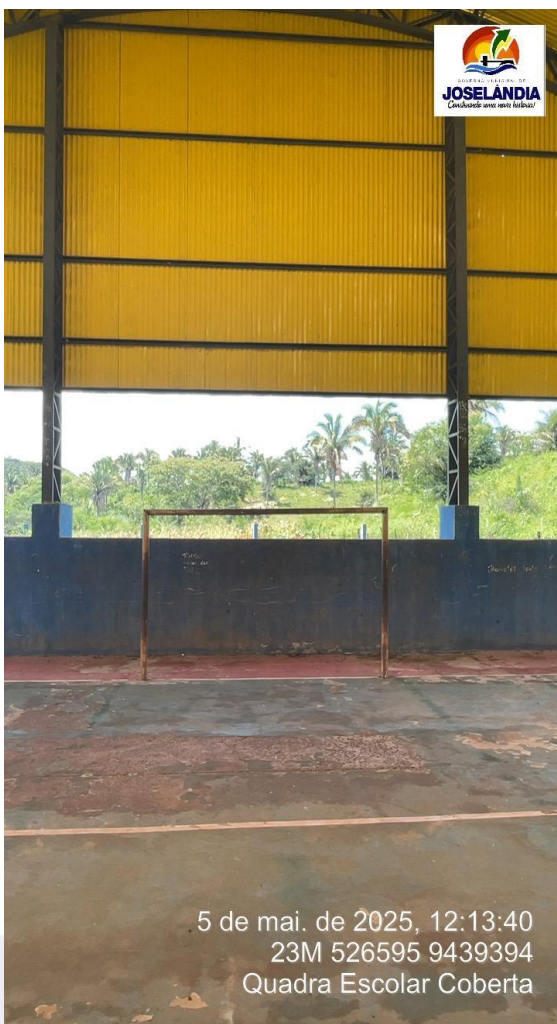
Foto 3 - Estrutura metálica da trave enferrujada e com soldas rompidas.