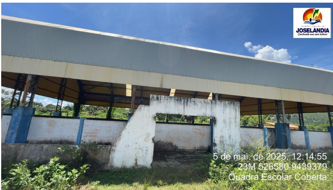
Foto 9 –Fachada principal apresentando pintura descascada, fissuras na alvenaria e sinais de infiltração de água.

GOVERNO MUNICIPAL DE JOSELÂNDIA Construindo uma nova história!