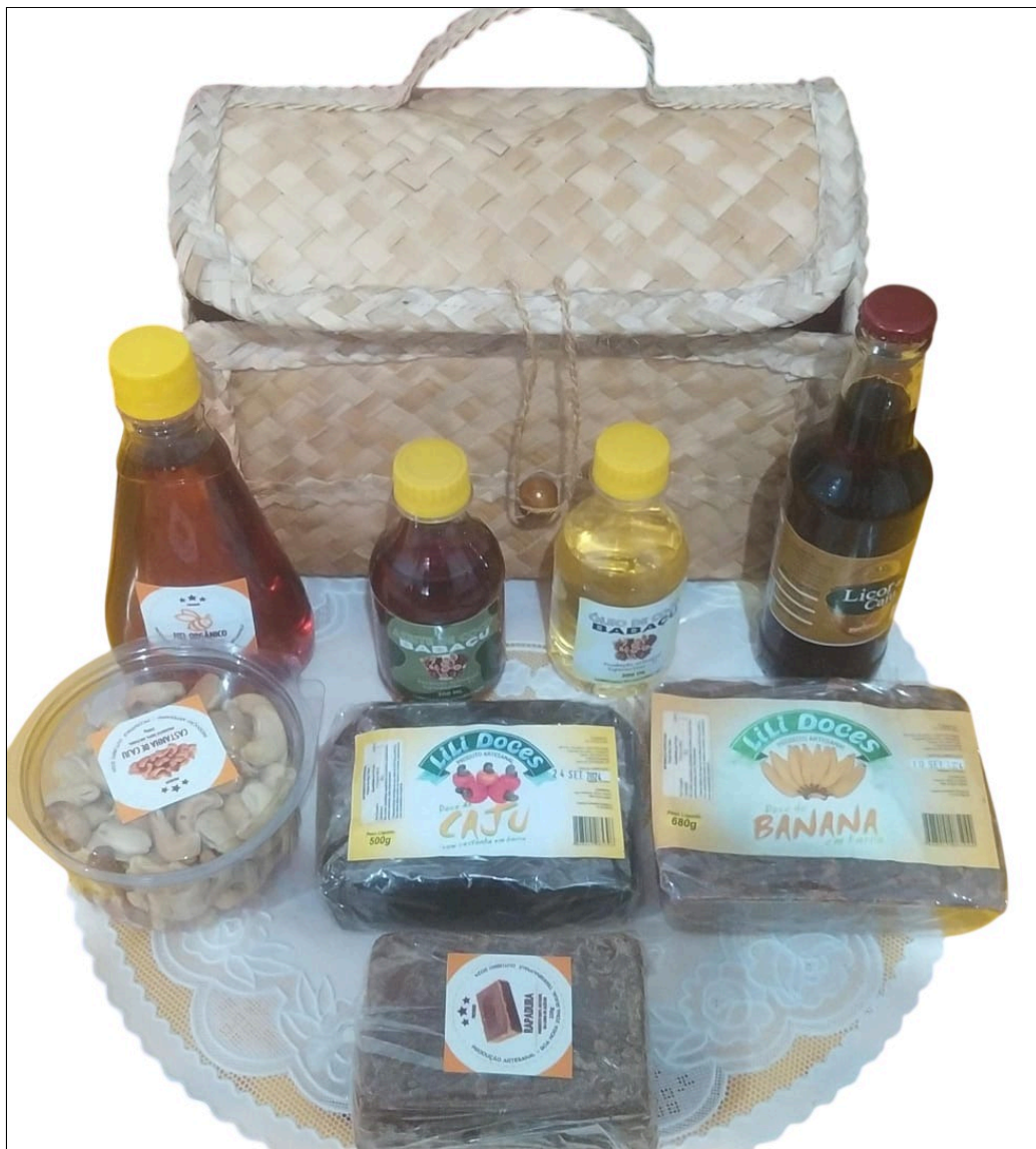
C) GRUPO 3: KIT LOUÇAS