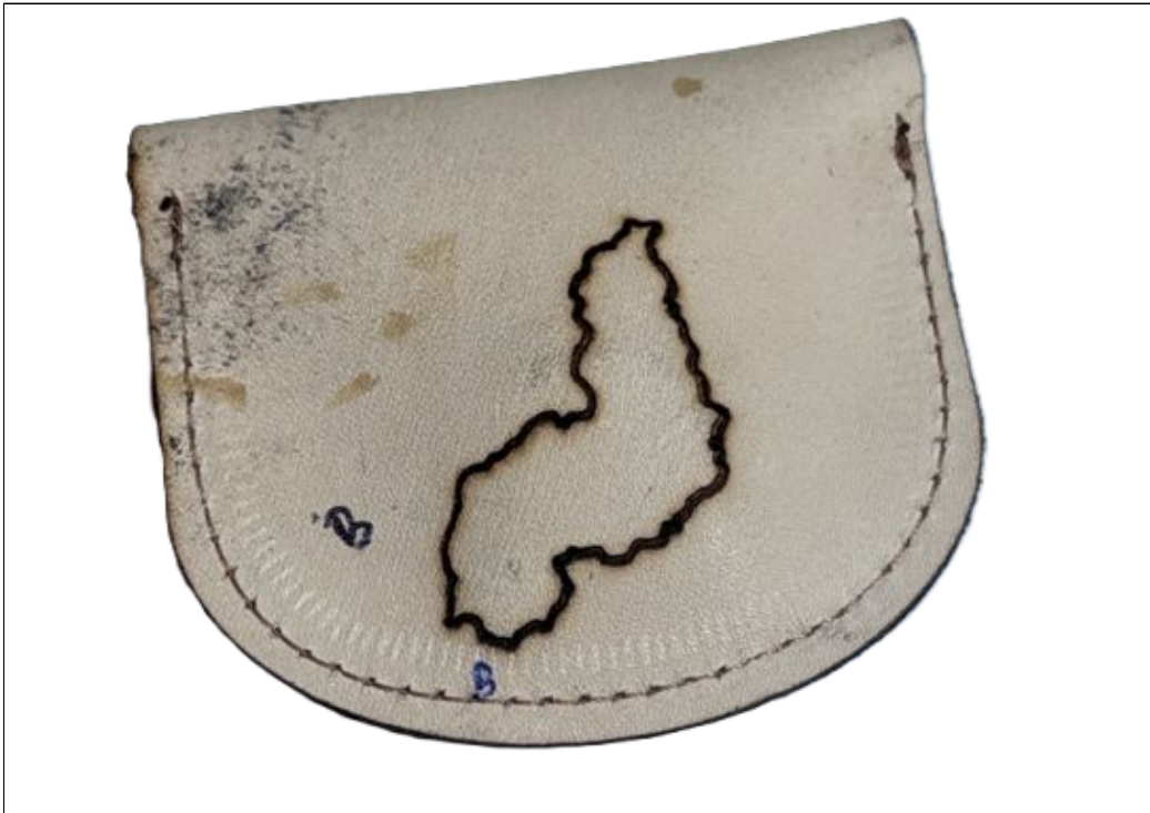
B) GRUPO 2: CESTA ARTESANAL