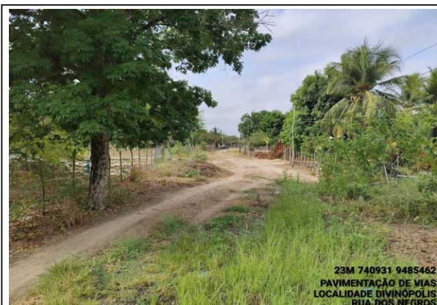
FOTO Nº 5 - RUA DOS NEGROS - LOC. DIVINÓPOLIS