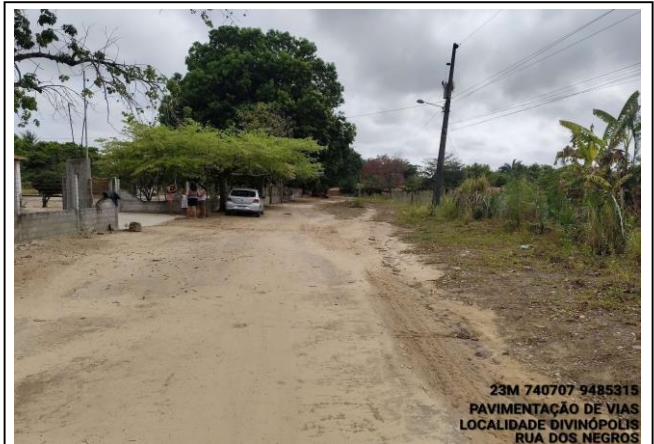
FOTO Nº 2 - RUA DOS NEGROS - LOC. DIVINÓPOLIS