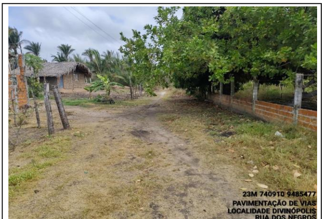
FOTO Nº 6 - RUA DOS NEGROS - LOC. DIVINÓPOLIS