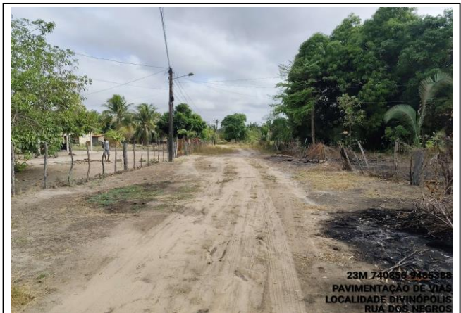
FOTO Nº 4 - RUA DOS NEGROS - LOC. DIVINÓPOLIS