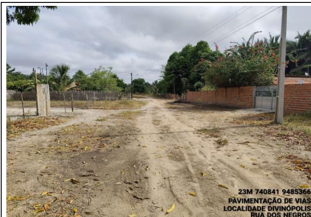
FOTO Nº 3 - RUA DOS NEGROS - LOC. DIVINÓPOLIS