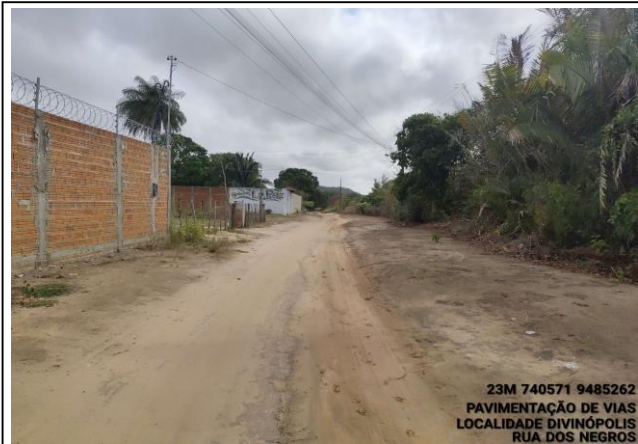
FOTO Nº 1 - RUA DOS NEGROS - LOC. DIVINÓPOLIS