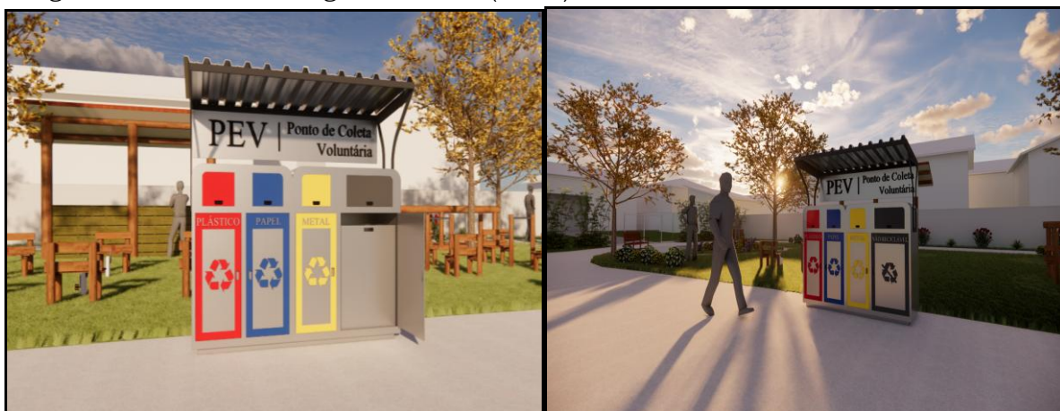
Imagem 01: Ponto de Entrega Voluntária (PEV's)

4.7.5.4. Cada educador deverá assegurar a presença regular nos PEVs sob sua responsabilidade, garantindo o suporte à triagem inicial dos materiais recicláveis, a orientação aos usuários, bem como a supervisão da utilização adequada das estruturas e equipamentos disponibilizados.