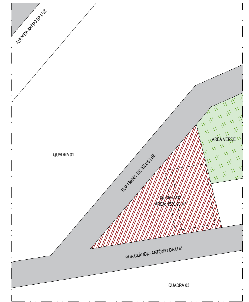
PLANTA DE SITUAÇÃO ESCALA: 1/1000