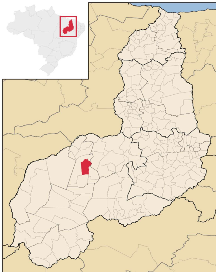
Localização do município de Bertolândia - PI

Bertolândia tem as seguintes coordenadas geográficas: Latitude: 7° 38' 28" Sul, Longitude: 43° 56' 60" Oeste.