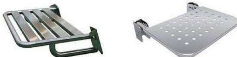
Figura 01 - Modelo de bancos articulados