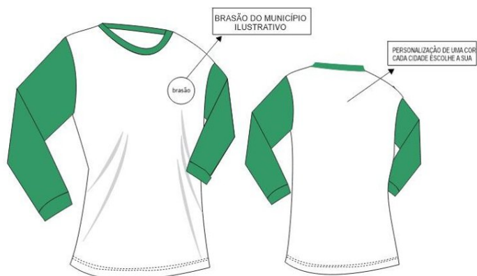
TABELA DE MEDIDAS - CAMISETA MANGA LONGA