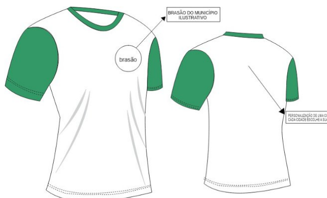
TABELA DE DIMENSÕES – CAMISETA MANGA CURTA