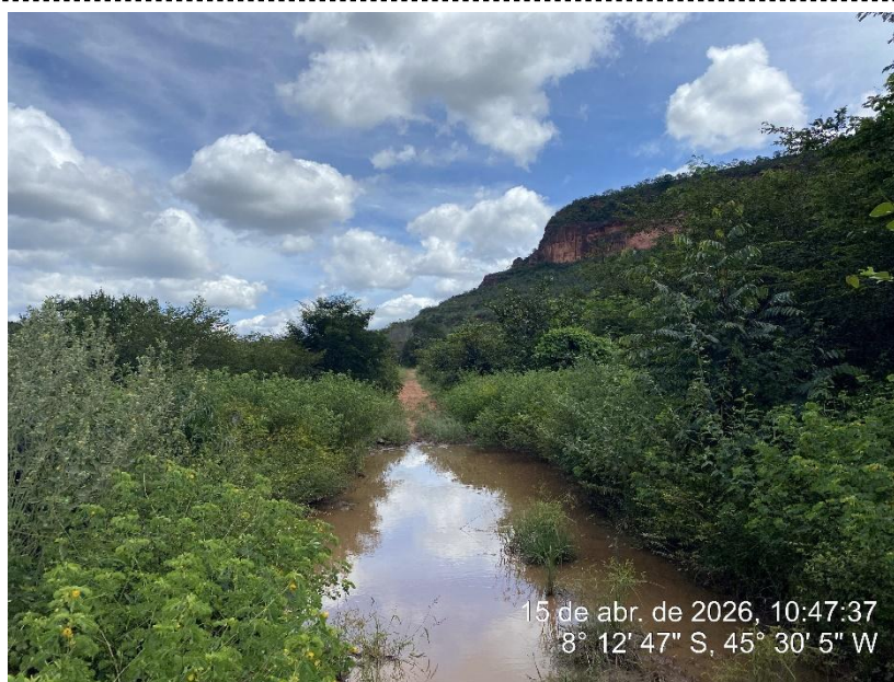
Tipo: Imagem térrea Descrição: Local da implantação do bueiro bueiro 4 (BTTC Ø 1,00 m)