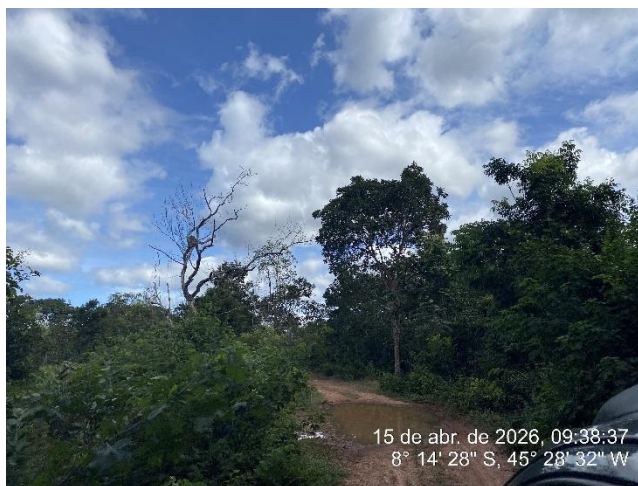
Tipo: Imagem térrea Descrição: Foto ao longo do trecho.