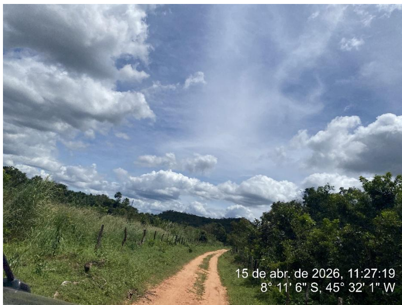
Tipo: Imagem térrea Descrição: Foto ao longo do trecho.

ESTADO DO PIAUÍ PREFEITURA MUNICIPAL DE RIBEIRO GONÇALVES SECRETARIA MUNICIPAL DE OBRAS, INFRAESTRUTURA E SERVIÇOS PÚBLICOS. Rua Landri Sales, 340, Centro, Ribeiro Gonçalves – Piauí CEP: 64.865 - 000 / Fone – 89 -3567-1378 /CNPJ – 06.728.240/0001-93 E-MAIL: infraestrutura – secretariainfraestruturarg@gmail.com