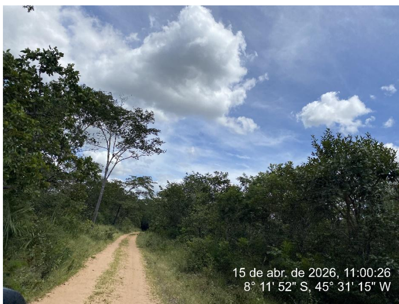
Tipo: Imagem térrea Descrição: Foto ao longo do trecho.