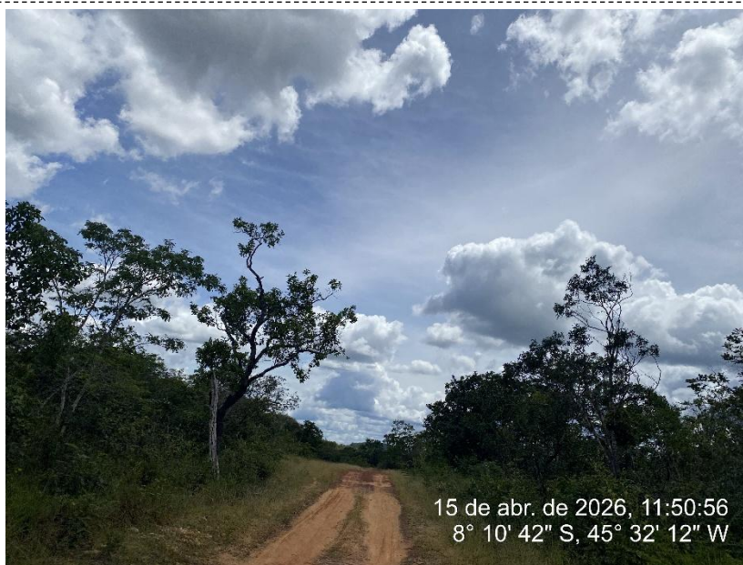
Tipo: Imagem térrea Descrição: Foto ao longo do trecho.

15 de abr. de 2026, 11:50:56 8° 10' 42" S, 45° 32' 12" W