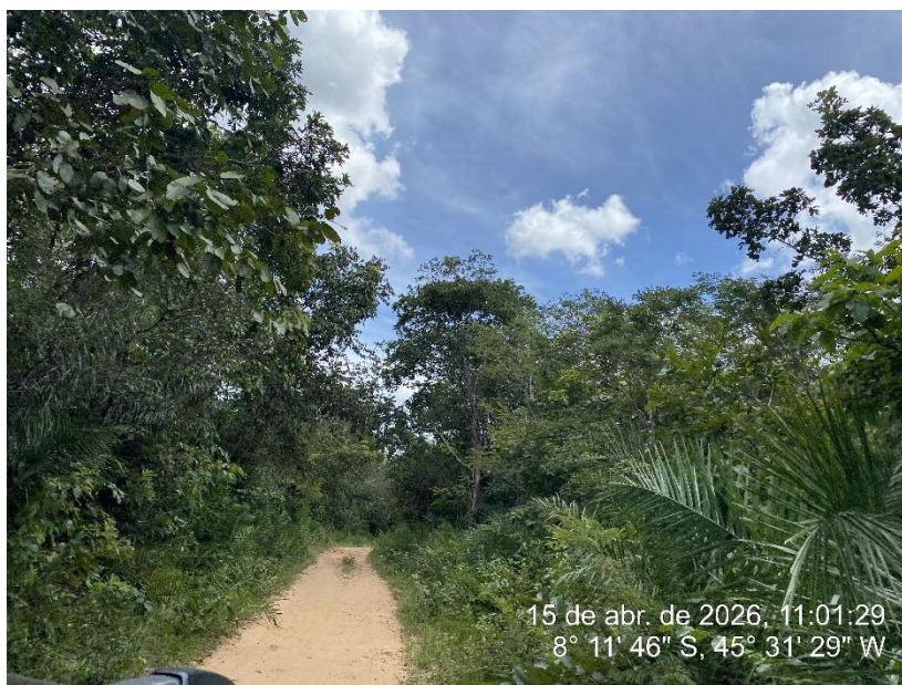
Tipo: Imagem térrea Descrição: Foto ao longo do trecho.

ESTADO DO PIAUÍ PREFEITURA MUNICIPAL DE RIBEIRO GONÇALVES SECRETARIA MUNICIPAL DE OBRAS, INFRAESTRUTURA E SERVIÇOS PÚBLICOS. Rua Landri Sales, 340, Centro, Ribeiro Gonçalves – Piauí CEP: 64.865 - 000 / Fone – 89 -3567-1378 /CNPJ – 06.728.240/0001-93 E-MAIL: infraestrutura – secretariainfraestruturarg@gmail.com