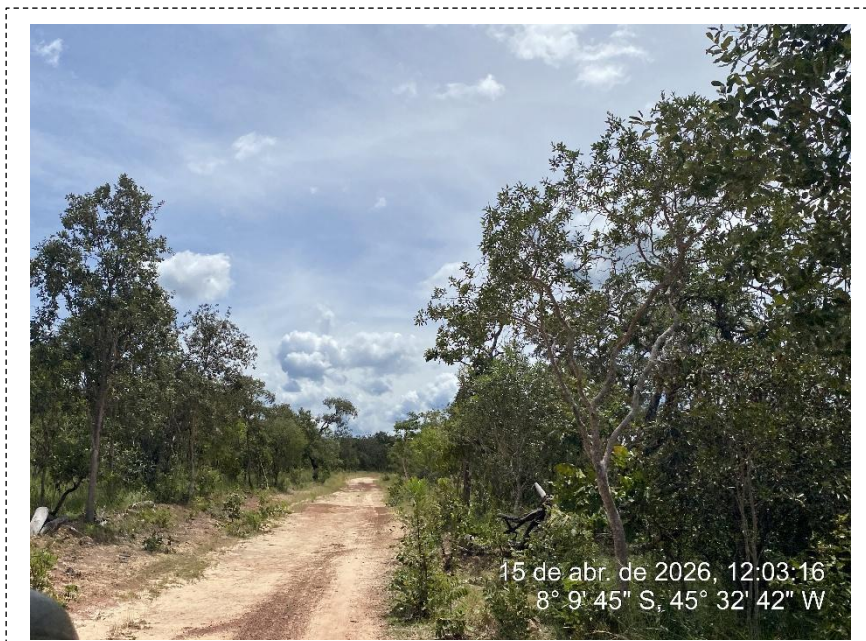
Tipo: Imagem térrea Descrição: Foto ao longo do trecho.