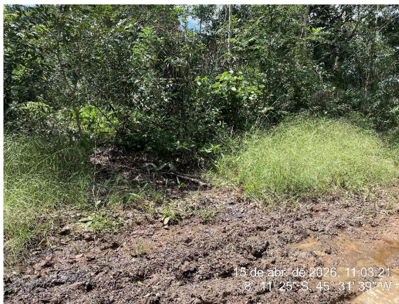
Tipo: Imagem térrea Descrição: Local da implantação do bueiro bueiro 3 (BTTC Ø 1,00 m)