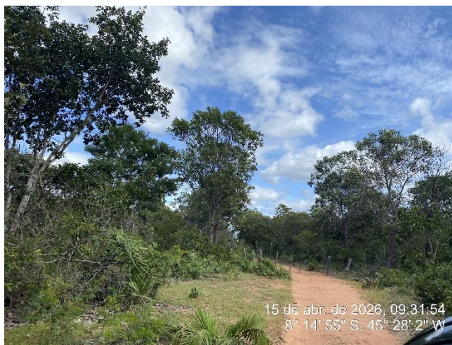
Tipo: Imagem térrea Descrição: Foto ao longo do trecho..