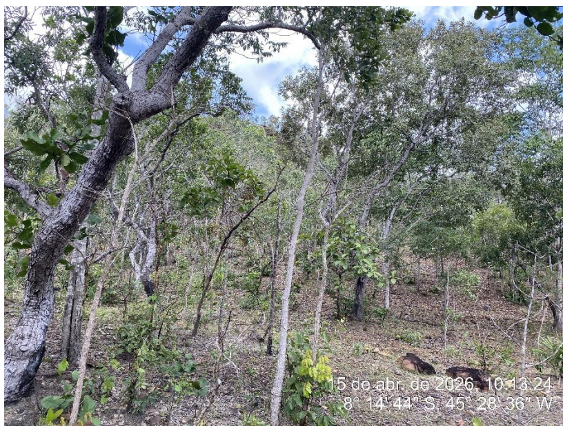
Tipo: Imagem térrea Descrição: Fonte de Jazida.