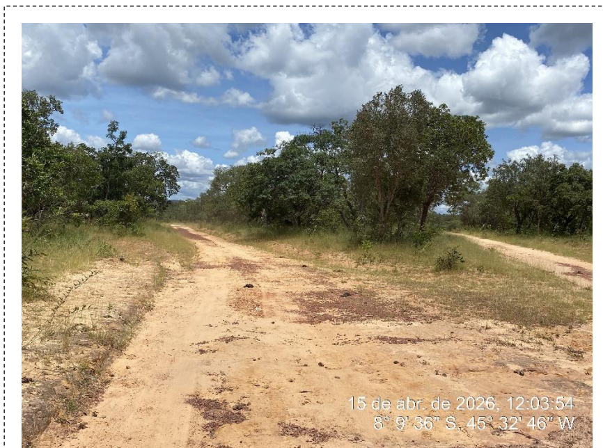
Tipo: Imagem térrea Descrição: Início do trecho.

Estrada Vicinal – Município de Ribeiro Gonçalves/PI