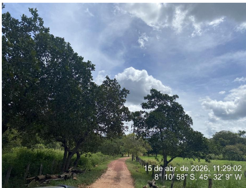
Tipo: Imagem térrea Descrição: Foto ao longo do trecho.