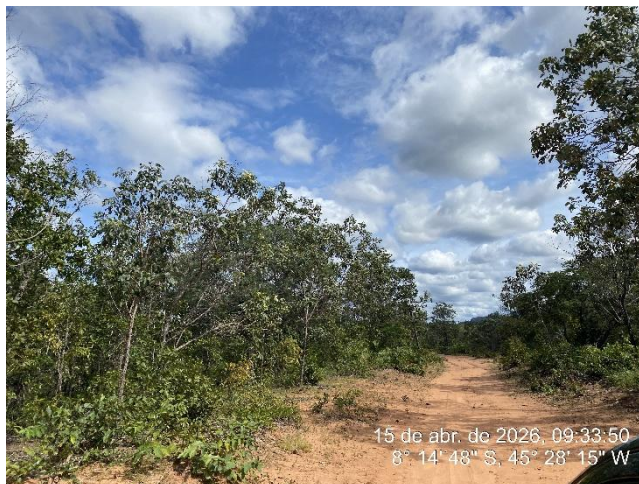
Tipo: Imagem térrea Descrição: Foto ao longo do trecho.

ESTADO DO PIAUÍ PREFEITURA MUNICIPAL DE RIBEIRO GONÇALVES SECRETARIA MUNICIPAL DE OBRAS, INFRAESTRUTURA E SERVIÇOS PÚBLICOS. Rua Landri Sales, 340, Centro, Ribeiro Gonçalves – Piauí CEP: 64.865 - 000 / Fone – 89 -3567-1378 /CNPJ – 06.728.240/0001-93 E-MAIL: infraestrutura – secretariainfraestruturarg@gmail.com