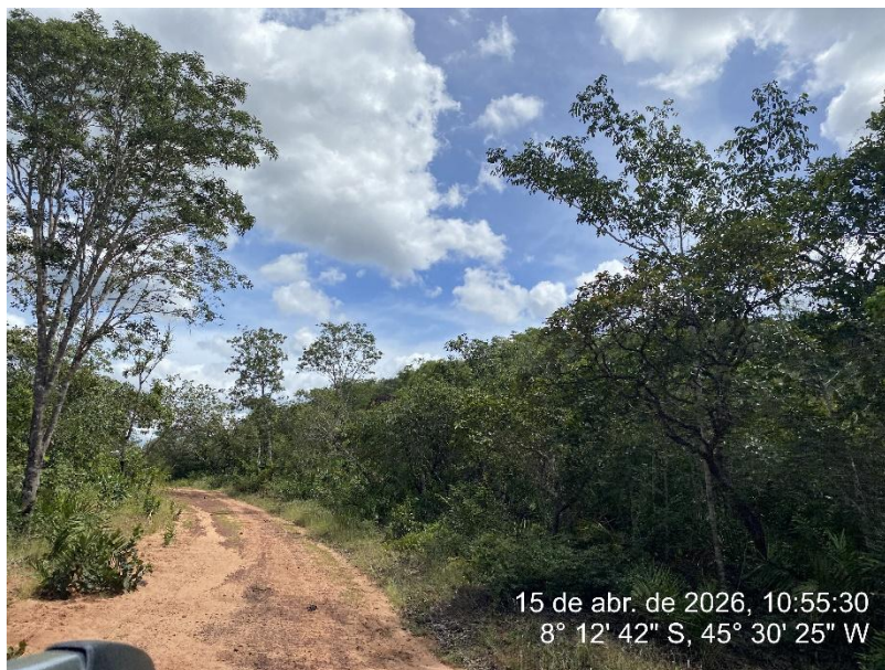
Tipo: Imagem térrea Descrição: Foto ao longo do trecho.

ESTADO DO PIAUÍ PREFEITURA MUNICIPAL DE RIBEIRO GONÇALVES SECRETARIA MUNICIPAL DE OBRAS, INFRAESTRUTURA E SERVIÇOS PÚBLICOS. Rua Landri Sales, 340, Centro, Ribeiro Gonçalves – Piauí CEP: 64.865 - 000 / Fone – 89 -3567-1378 /CNPJ – 06.728.240/0001-93 E-MAIL: infraestrutura – secretariainfraestruturarg@gmail.com