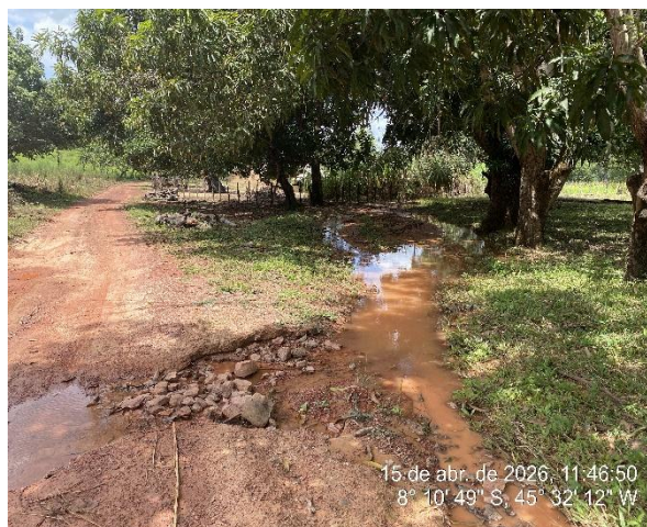
Tipo: Imagem térrea Descrição: Local da implantação do bueiro 2 (BSTC Ø 1,00 m)

ESTADO DO PIAUÍ PREFEITURA MUNICIPAL DE RIBEIRO GONÇALVES SECRETARIA MUNICIPAL DE OBRAS, INFRAESTRUTURA E SERVIÇOS PÚBLICOS. Rua Landri Sales, 340, Centro, Ribeiro Gonçalves – Piauí CEP: 64.865 - 000 / Fone – 89 -3567-1378 /CNPJ – 06.728.240/0001-93 E-MAIL: infraestrutura – secretariainfraestruturarg@gmail.com