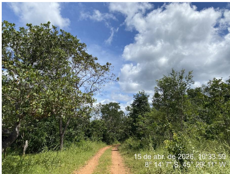
Tipo: Imagem térrea Descrição: Foto ao longo do trecho.

ESTADO DO PIAUÍ PREFEITURA MUNICIPAL DE RIBEIRO GONÇALVES SECRETARIA MUNICIPAL DE OBRAS, INFRAESTRUTURA E SERVIÇOS PÚBLICOS. Rua Landri Sales, 340, Centro, Ribeiro Gonçalves – Piauí CEP: 64.865 - 000 / Fone – 89 -3567-1378 /CNPJ – 06.728.240/0001-93 E-MAIL: infraestrutura – secretariainfraestruturarg@gmail.com