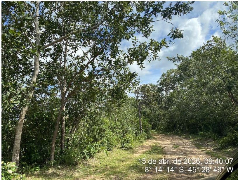
Tipo: Imagem térrea Descrição: Foto ao longo do trecho.

ESTADO DO PIAUÍ PREFEITURA MUNICIPAL DE RIBEIRO GONÇALVES SECRETARIA MUNICIPAL DE OBRAS, INFRAESTRUTURA E SERVIÇOS PÚBLICOS. Rua Landri Sales, 340, Centro, Ribeiro Gonçalves – Piauí CEP: 64.865 - 000 / Fone – 89 -3567-1378 /CNPJ – 06.728.240/0001-93 E-MAIL: infraestrutura – secretariainfraestruturarg@gmail.com