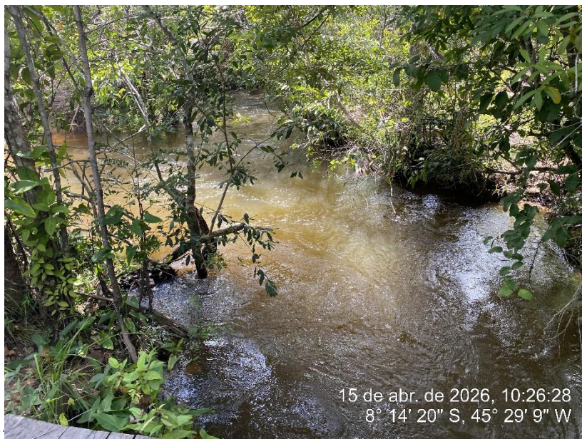
Tipo: Imagem térrea Descrição: Fonte de água.

ESTADO DO PIAUÍ PREFEITURA MUNICIPAL DE RIBEIRO GONÇALVES SECRETARIA MUNICIPAL DE OBRAS, INFRAESTRUTURA E SERVIÇOS PÚBLICOS. Rua Landri Sales, 340, Centro, Ribeiro Gonçalves – Piauí CEP: 64.865 - 000 / Fone – 89 -3567-1378 /CNPJ – 06.728.240/0001-93 E-MAIL: infraestrutura – secretariainfraestruturarg@gmail.com