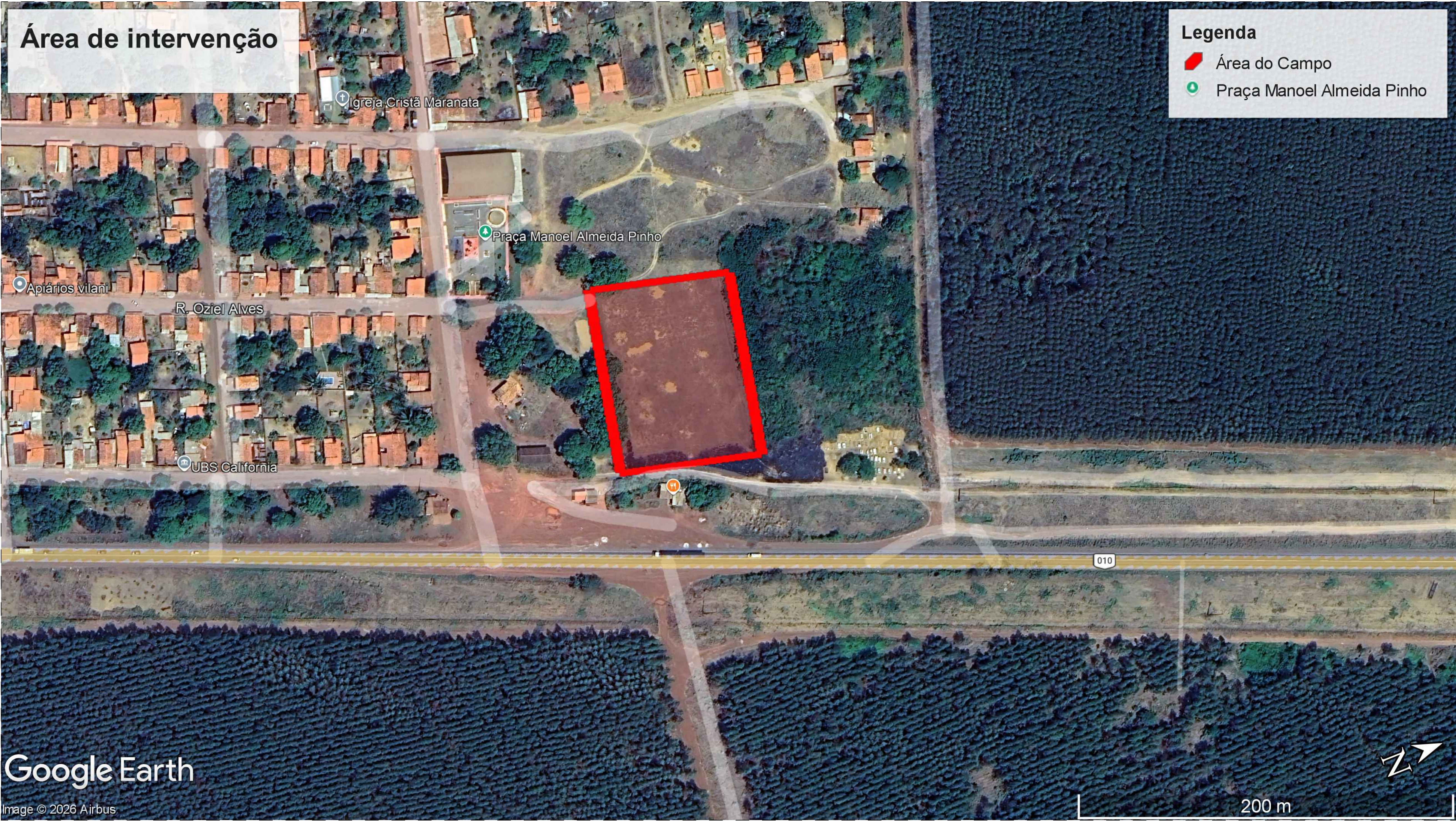
PLANTA DE LOCALIZAÇÃO