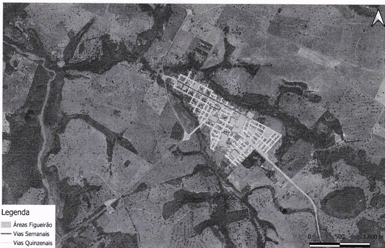
Mapa 1 - Áreas e vias públicas para os serviços de limpeza na cidade de Figueirão - MS

Estimativa de Quantitativos e Memória de Cálculo – Serviços de Limpeza Urbana: