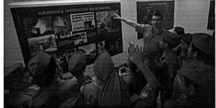
ALUNOS do CMCB participam de primeira visita guiada ao museu do Corpo de Bombeiros

KLEBER CARVALHO joao.kleber@opovo.com.br