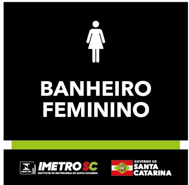
16 placas - Banheiro feminino