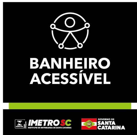
1 placa – Banheiro Acessível

2.1.10.4 - Apresentar layout com as medidas e devidas proporções para aprovação, antes da confecção.