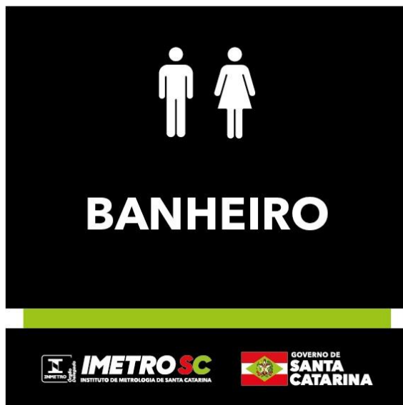
21 placas - Banheiro Unissex