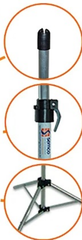
Figura 1: Modelo e detalhe de Porta Banner tam. P