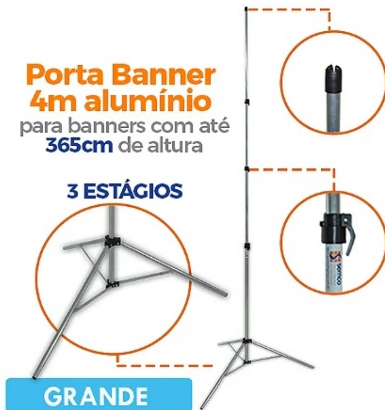
Figura 3: Modelo e detalhe de Porta Banner tam. G