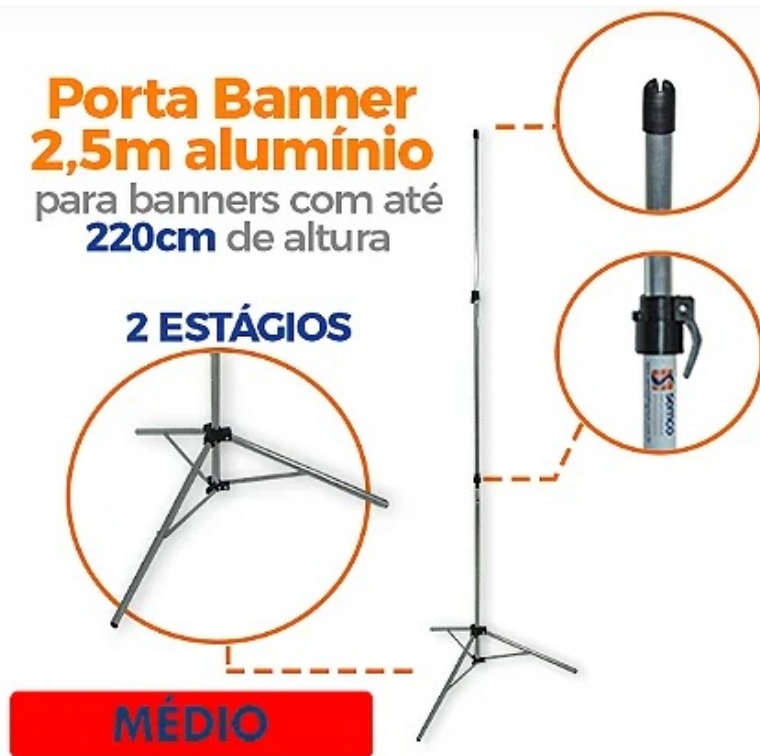
Figura 2: Modelo e detalhes de Porta Banner tam. M