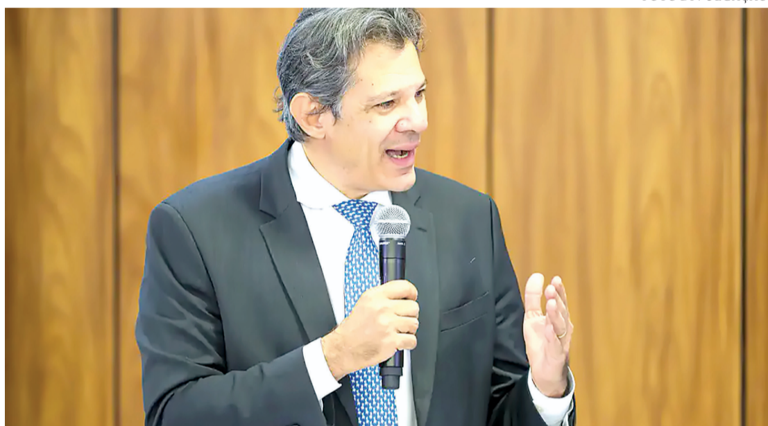
O ministro disse também que a MP vai prever uma cobrança por manutenção de empregos

Para tentar amenizar os impactos do tarifaço sobre as empresas, o governo de Luiz Inácio Lula da Silva (PT) prepara um pacote de medidas, que deve incluir linhas de crédito e o diferimento de tributos (um prazo adicional para que as companhias efetuem o pagamento dos impostos).