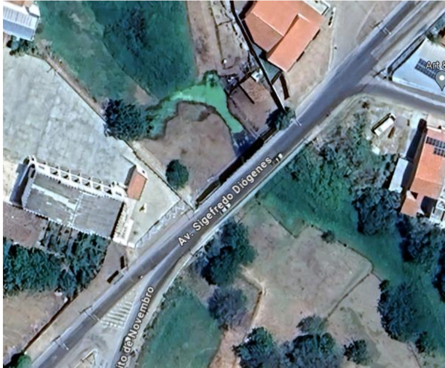
Figura 2: Foto via satélite da ponte da Av. Sigefredo Diógenes.