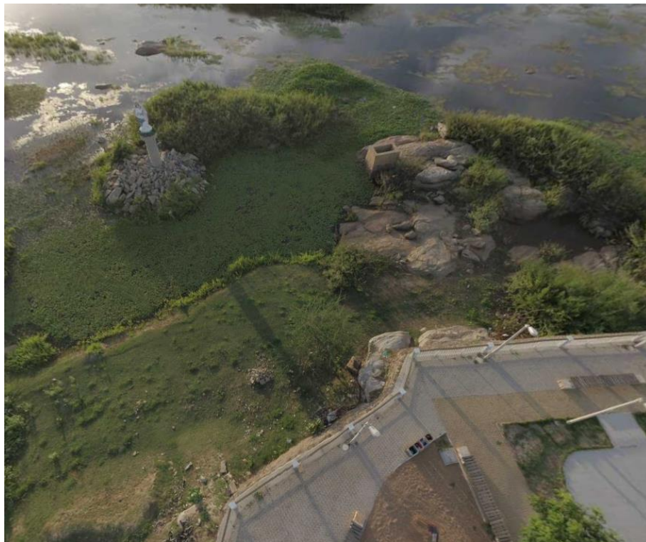
Figura 3: Foto via satélite do local de implantação da passarela que liga a Estátua Nossa Senhora das Candeias à Praça de Alimentação.