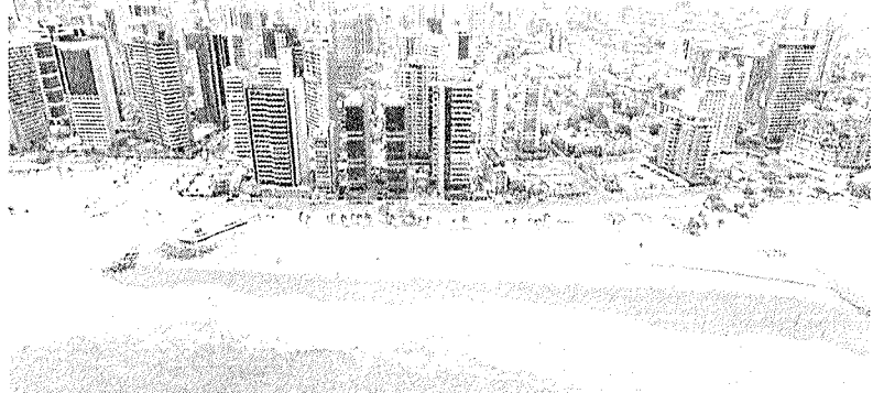
O desempenho do turismo reforça o papel estratégico do setor na economia

O desempenho anual do turismo reforça o papel estratégico do setor na economia estadual, especialmente em um contexto de oscilações mensais