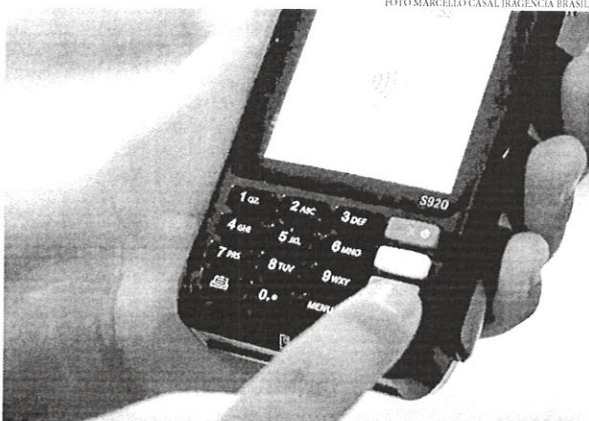
O cartão de crédito figura como o principal foco das dívidas financeiras

to, essas operações não foram incluídas no novo Desenrola, cujo desenho prevê renegociação para dívidas com atraso entre 90 dias e dois anos. Já no crédito pessoal ou empréstimo bancário, segunda modalidade mais frequente entre os débitos financeiros, há uma concentração ainda maior de dívidas antigas: 43% têm mais de dois anos de atraso.