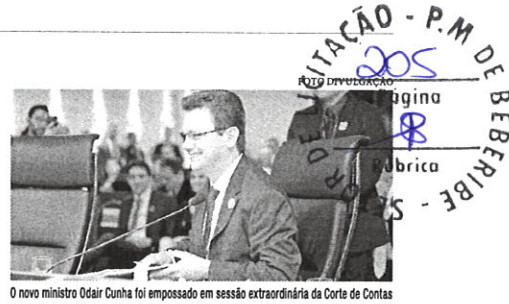
O novo ministro Odair Cunha foi empossado em sessão extraordinária da Corte de Contas

Odair Cunha toma posse como novo ministro do TCU com presença de Lula e petistas