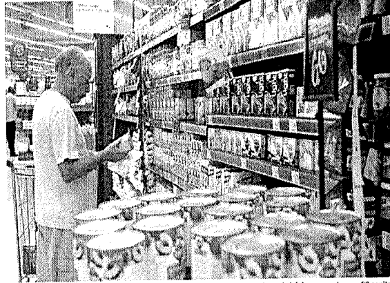
Na comparação em 12 meses, entre junho de 2025 e junho de 2026, o preço da cesta básica aumentou em 26 capitais

São Paulo foi a capital com a cesta básica mais cara do País em junho, ao custo de R$ 965,47. Na sequência aparecem Curitiba, com R$ 937,93; Rio de Janeiro, com R$ 920,94; e Florianópolis, com R$ 918,42. Já nas cidades do Norte e do Nordeste, onde a composição da ces-