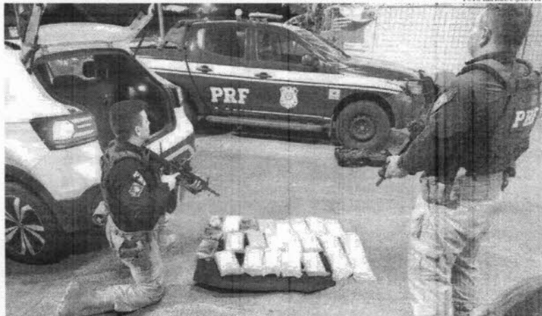
A apreensão mais recente ocorreu no km 17 da BR-116, pela Polícia Rodoviária Federal

Operações em Itaitinga e Pacatuba resultaram na apreensão de cocaína e maconha, além da prisão de dois suspeitos por tráfico de drogas