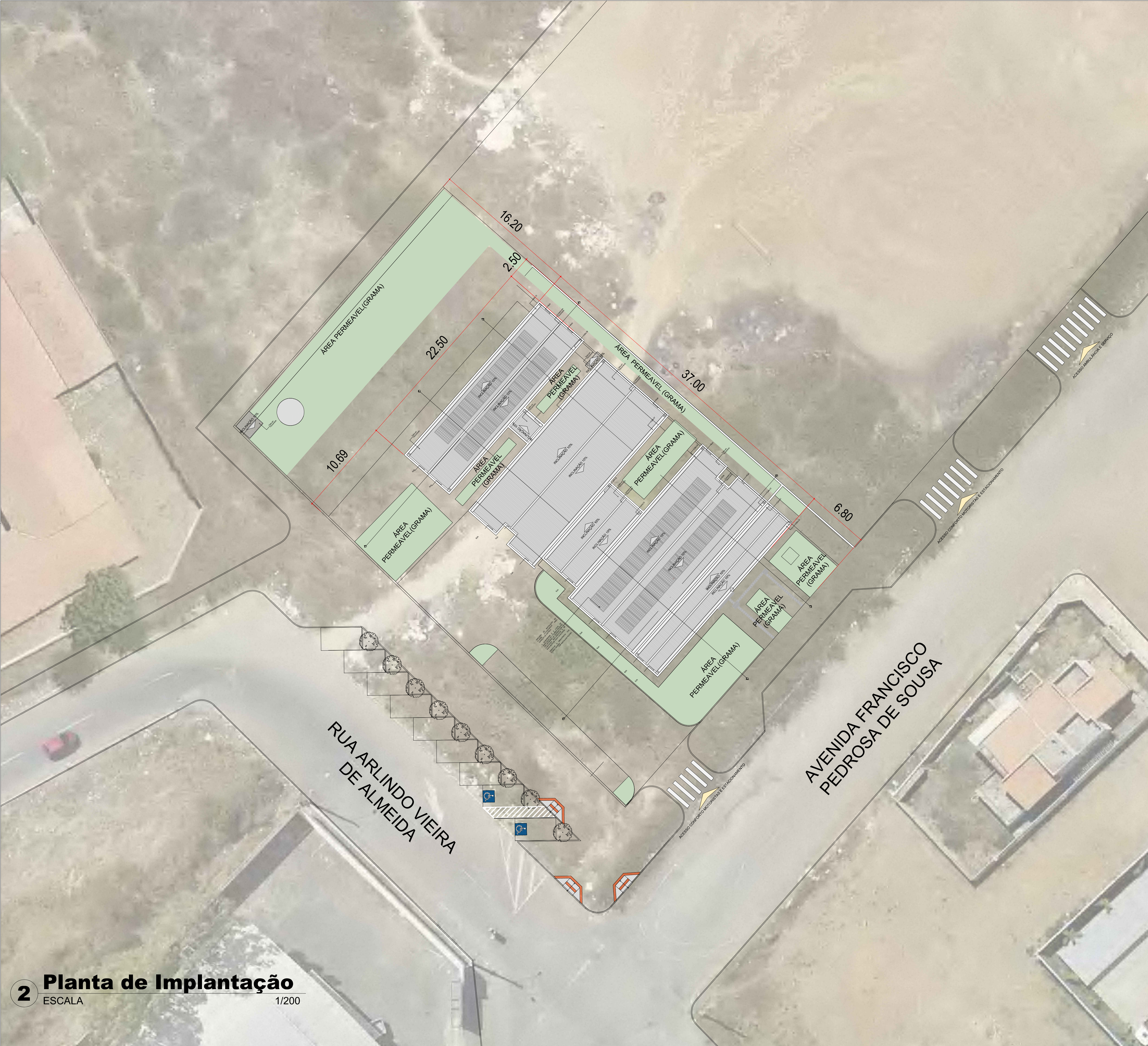
2 Planta de Implantação