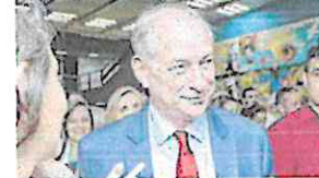
CIRO Gomes aparece bem na pesquisa