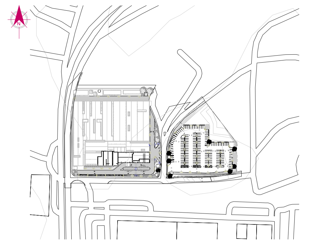
1 MAPA CHAVE SEM ESCALA