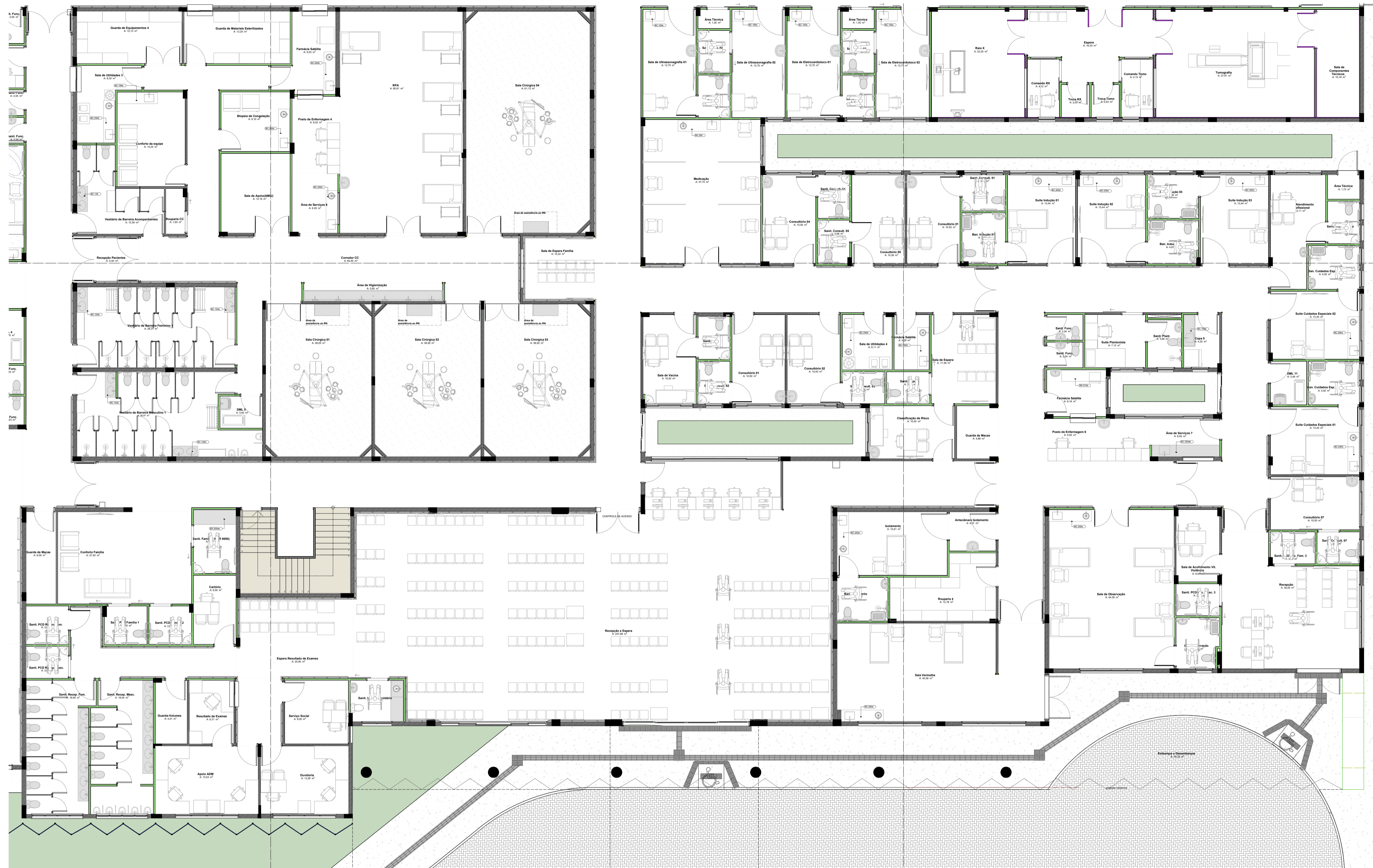
PLANTA DE LAYOUT TÉRREO Escala: 1:75