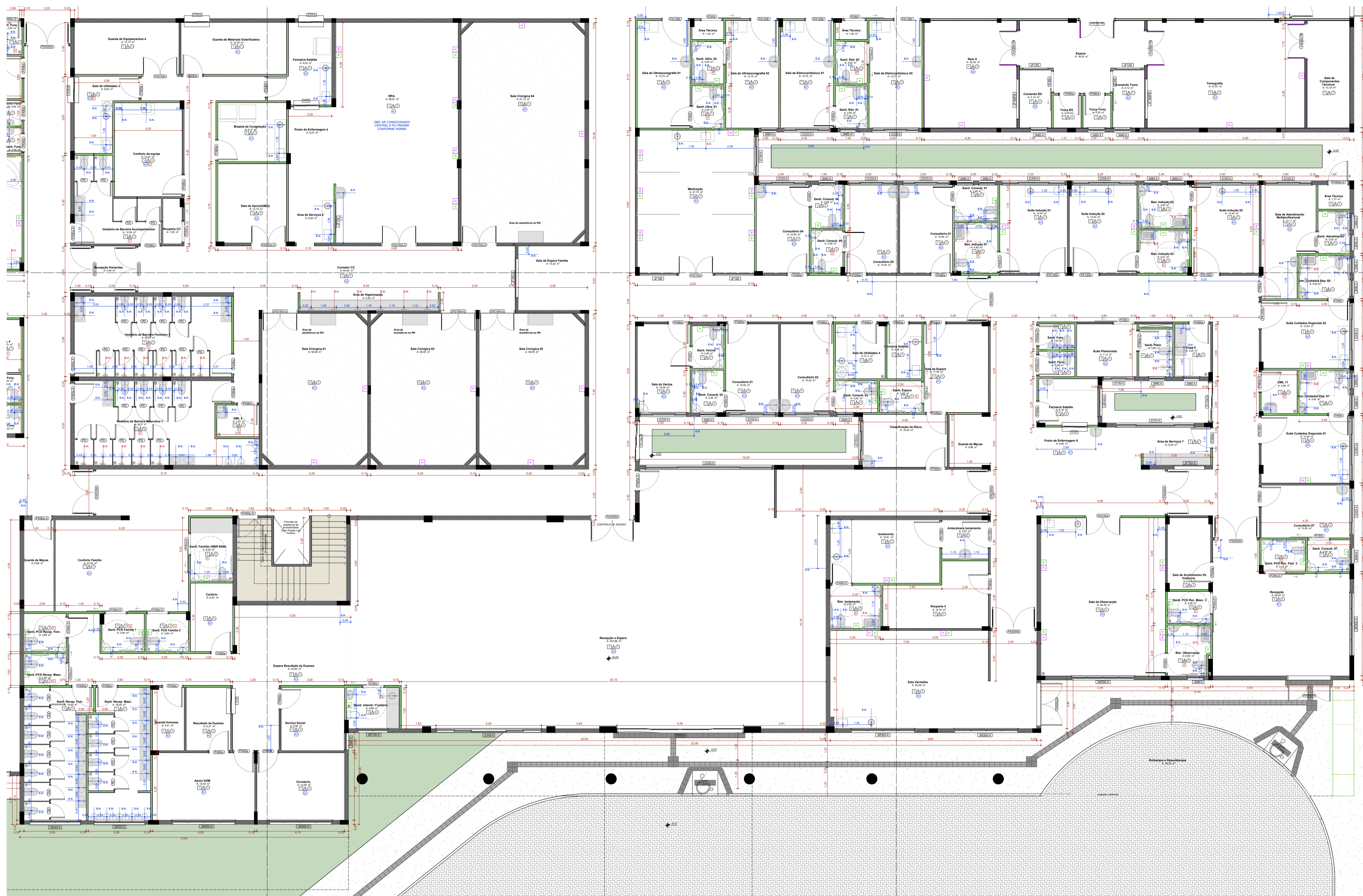
PLANTA TÉCNICA TERREO