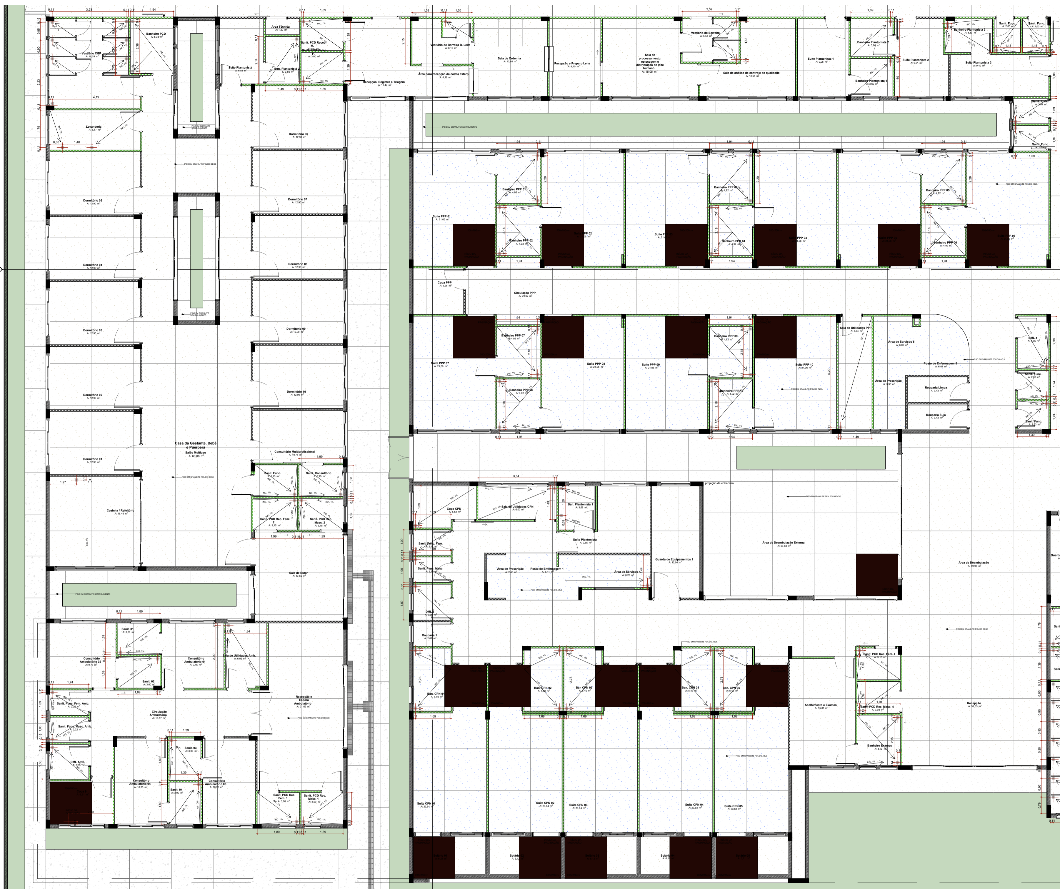
PLANTA PISO TÉRREO Escala: 1:75