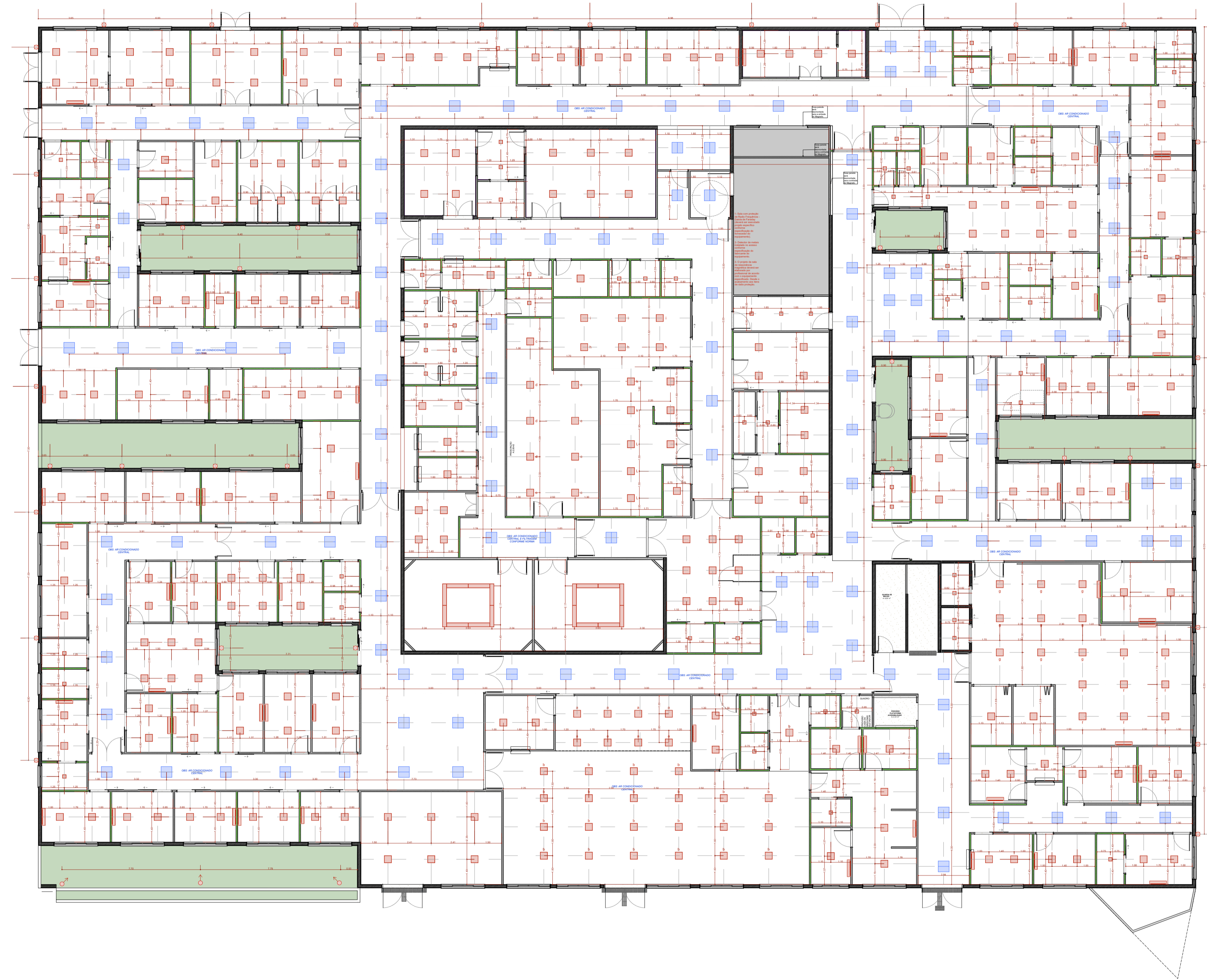
PLANTA FORRO TÉRREO 1:100