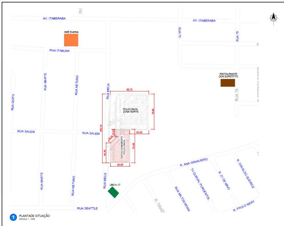
Figura 1 – Planta de Localização do Empreendimento.

O empreendimento da Unidade de Atenção Especializada em Saúde – Policlínica Zona Norte, localiza-se na Rua Meca, bairro Nova Cidade, zona norte do município de Manaus/AM, representado e identificado na figura a seguir: