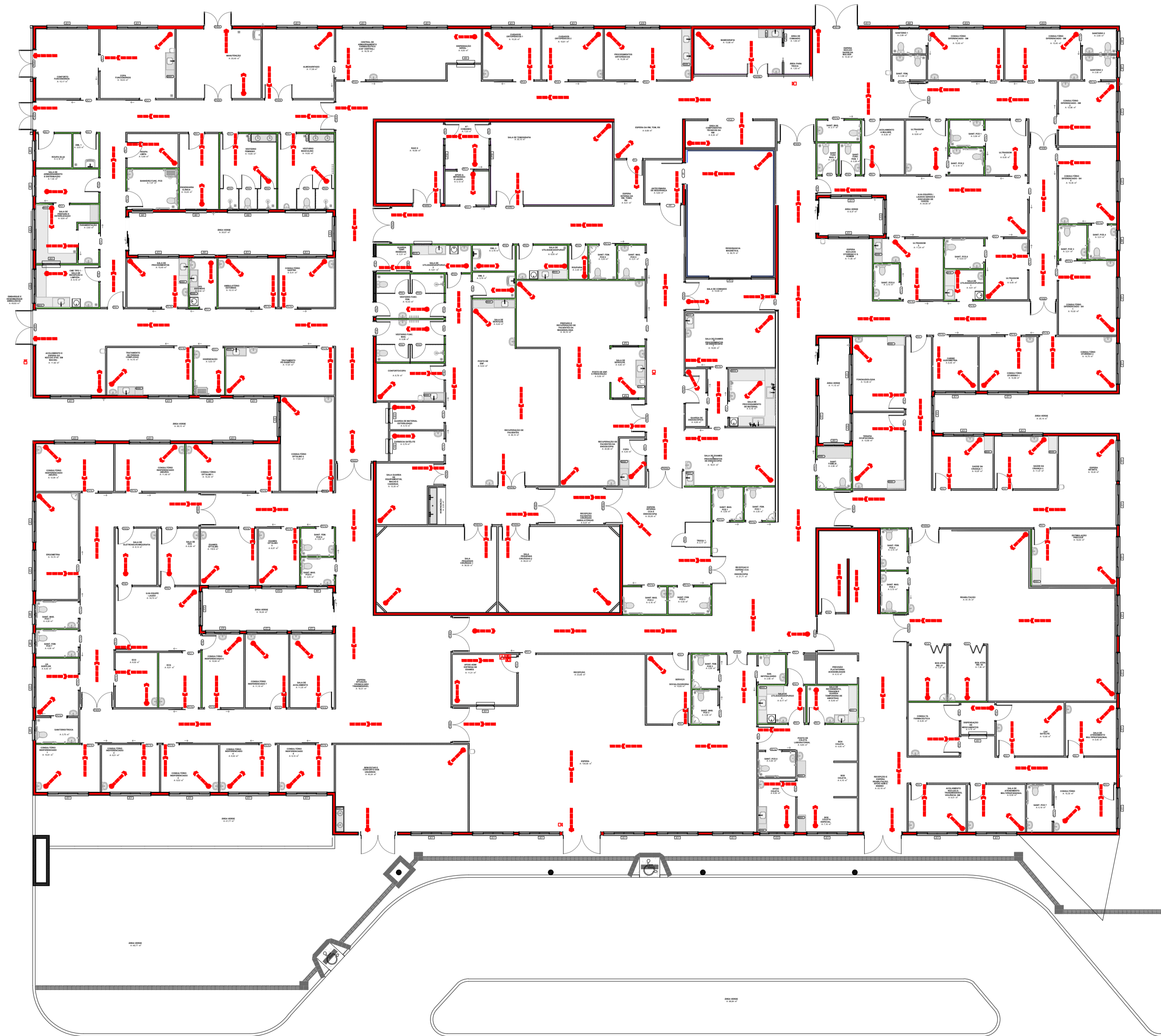
PLANTA BAIXA POLICLINICA ESCALA: 1/200