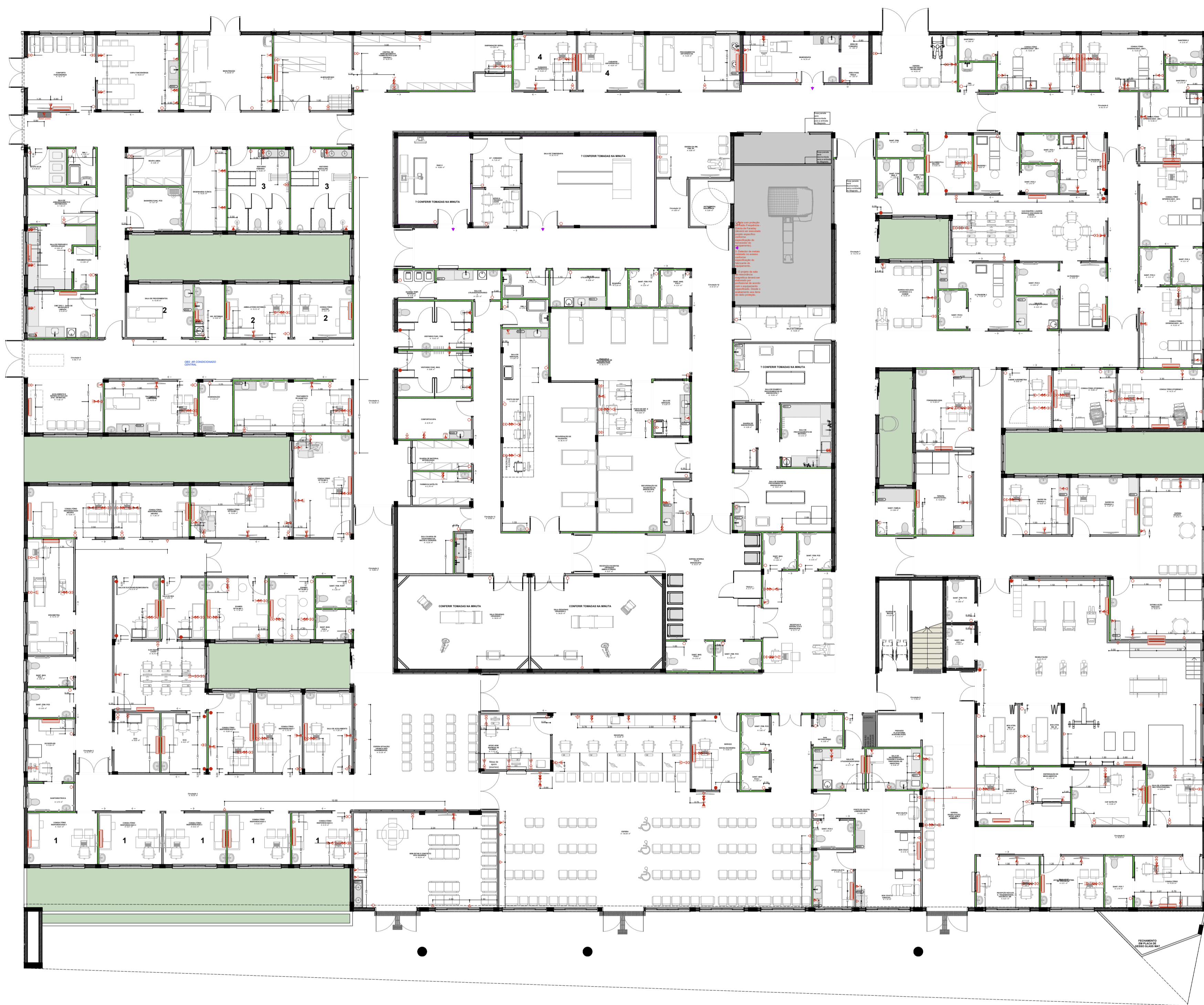
PLANTA ELÉTRICA TÉRREO 1:100