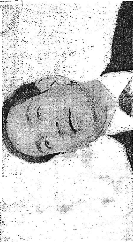
MARCO RUBIO , secretário de estado dos Estados Unidos.

Enquanto a classificação de Terroristas Globais Especialmente Designados ("Specially Designated Global Terrorists") já entrou em vigor, as duas facções devem ser oficialmente