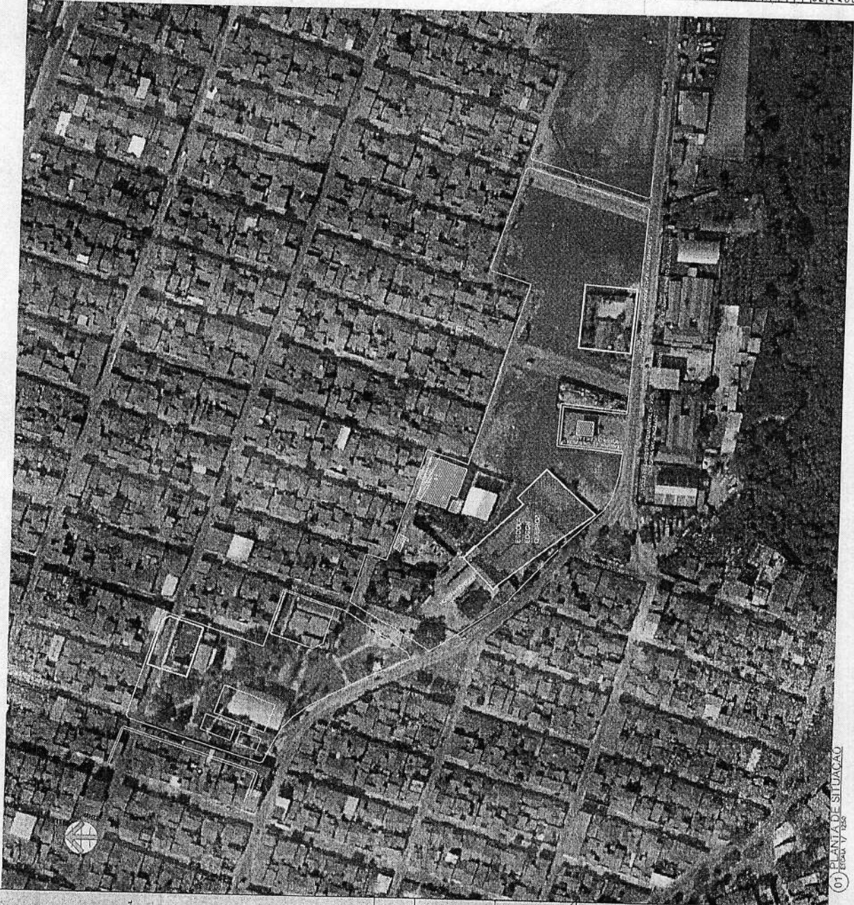
01) PLANTA DE SITUAÇÃO Escala 1:2500

SECRETARIA MUNICIPAL DE EDUCAÇÃO RUA CAPITÃO VALDEMAR DE LIMA, 202 - CENTRO - MARACANÃ - CEP: 01138-000 RUA CAPITÃO VALDEMAR DE LIMA, 202 - CENTRO - MARACANÃ - CEP: 01138-000 RUA CAPITÃO VALDEMAR DE LIMA, 202 - CENTRO - MARACANÃ - CEP: 01138-000 PROJETO: ESCOLA MUNICIPAL EDSON QUEIROZ PROJETO: ESCOLA MUNICIPAL EDSON QUEIROZ PROJETO: ESCOLA MUNICIPAL EDSON QUEIROZ PROJETO ARQUITETÔNICO PROJETO ARQUITETÔNICO PROJETO ARQUITETÔNICO ESCALA: 1:1000 1:1000 1:1000 CODIGO: 01/07 AUTOR DE PROJETO: L. NETO AUTOR DE PROJETO: L. NETO AUTOR DE PROJETO: L. NETO DATA ANUAL: 01/07 ANO: 2012