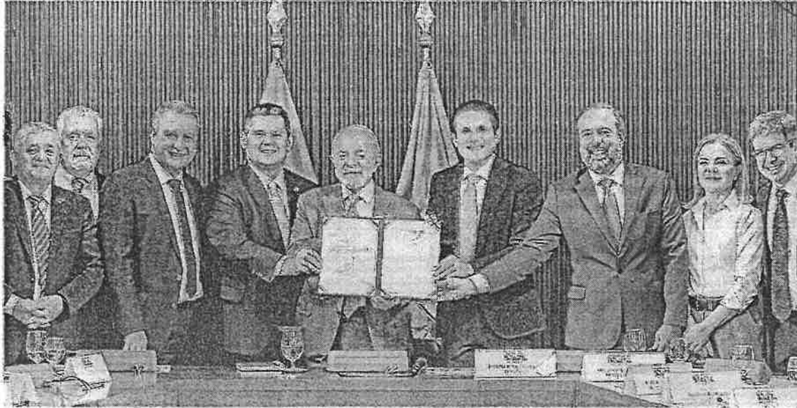
GOVERNO assina MP da reforma do setor elétrico