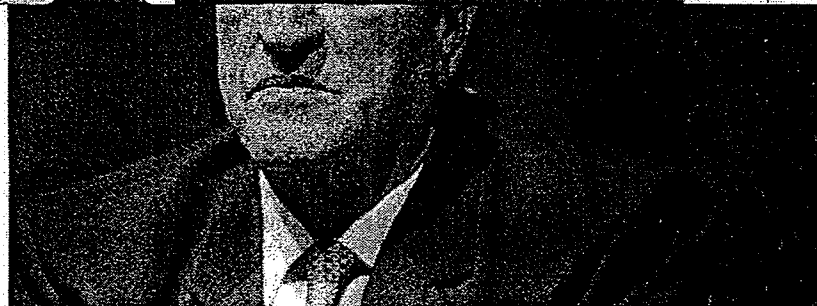
O PRESIDENTE nacional do Partido Liberal (PL), Valdemar Costa Neto

O dirigente do PL também minimizou as cobranças feitas por Flávio ao dono do Master para obter recursos para o filme. Segundo ele, o senador precisava levantar verba para viabilizar a produção e não tinha muitas opções. Sobre a visita ter ocorrido mesmo em meio aos problemas do banqueiro com a Justiça, ele afirmou: “Ué, fazer o quê?”