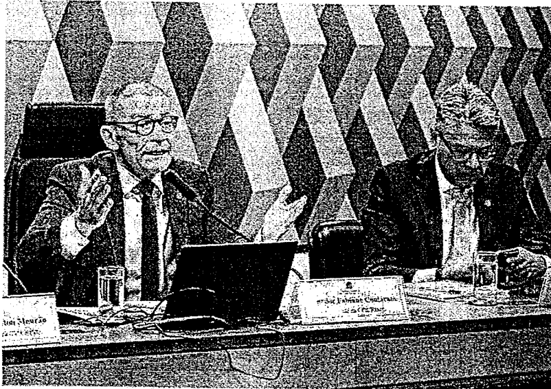
CPI do Crime Organizado terminou sem relatório final