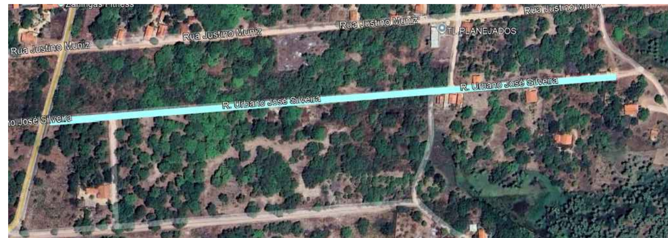
03 TRECHO URBANO JOSÉ SILVEIRA EXTENSÃO — 696 M