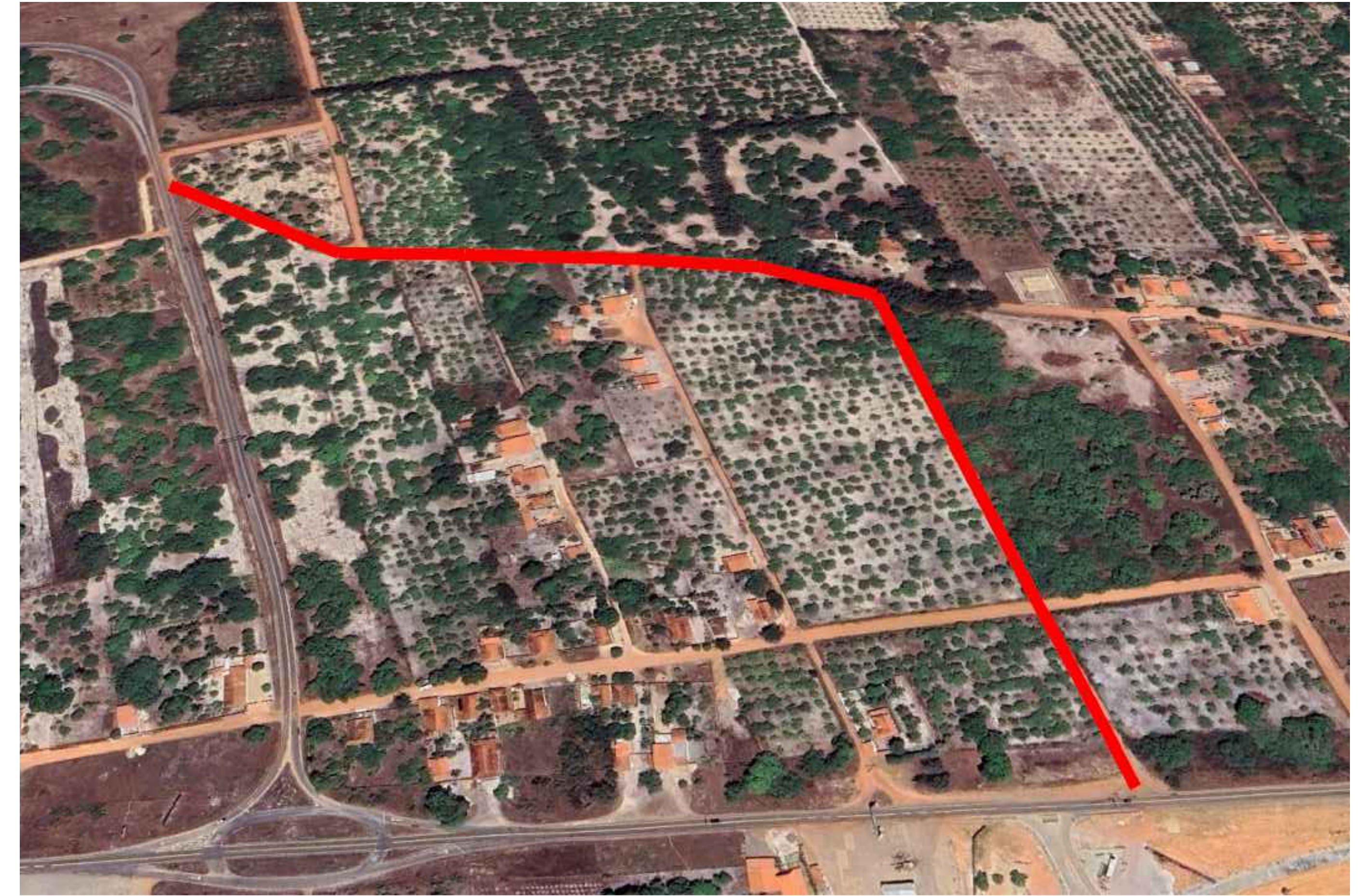
02 TRECHO CE-085 AO AEROPORTO EXTENSÃO — 950 M