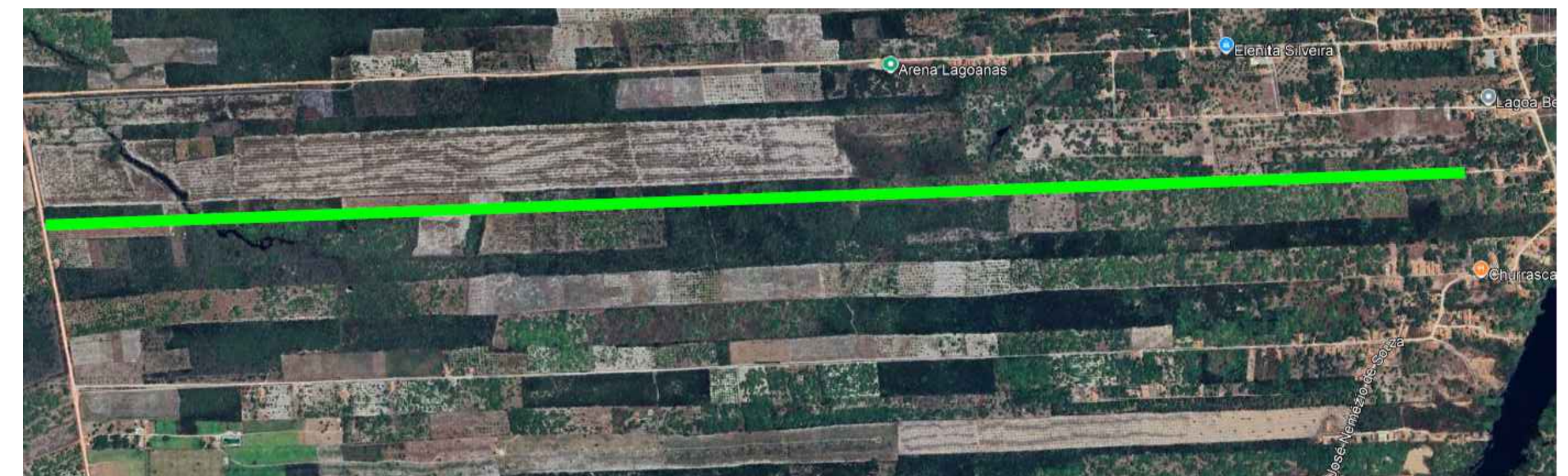
04 TRECHO LAGOA VELHA EXTENSÃO — 3.533 M