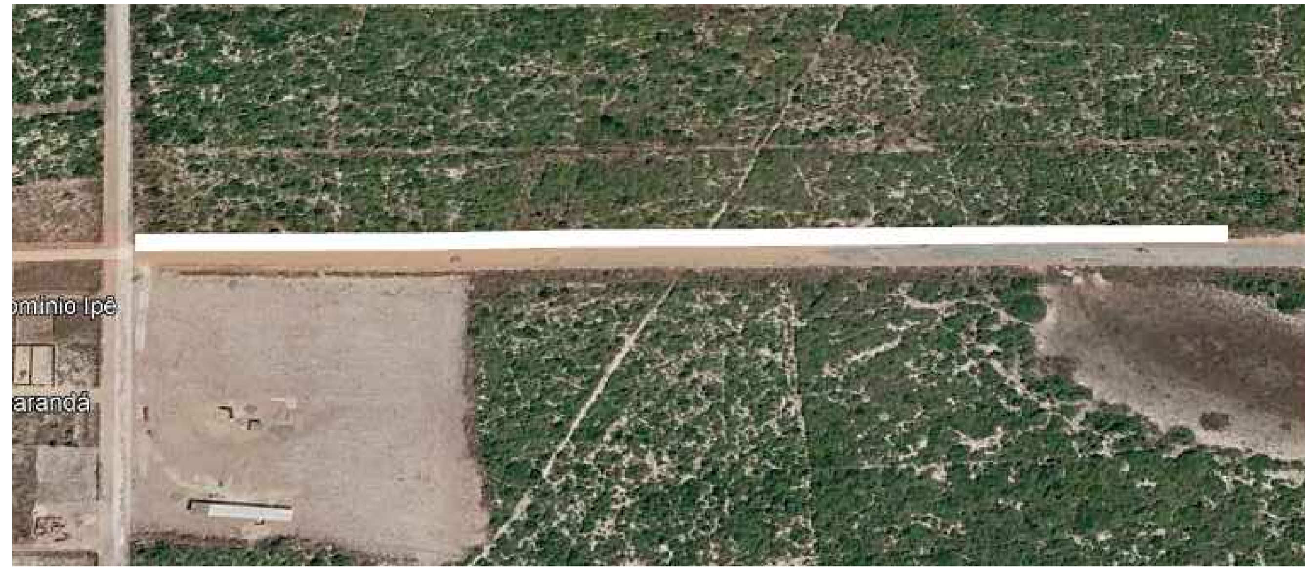
01 TRECHO CAVALO BRAVO EXTENSÃO — 509 M