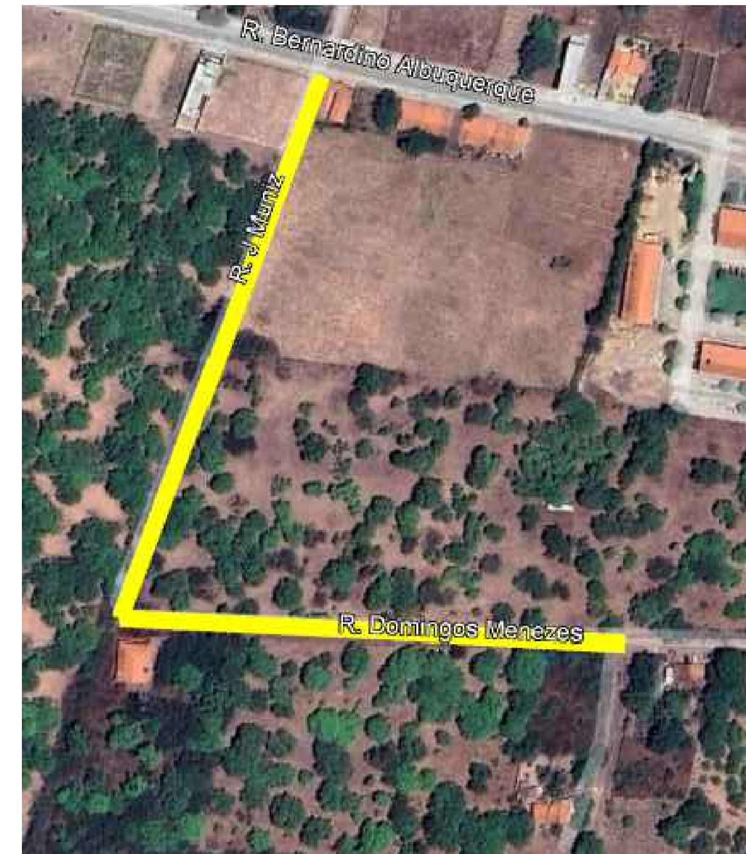
06 TRECHO DOMINGOS MENEZES PERPENDICULAR A J. MUNIZ EXTENSÃO ——— 504 M