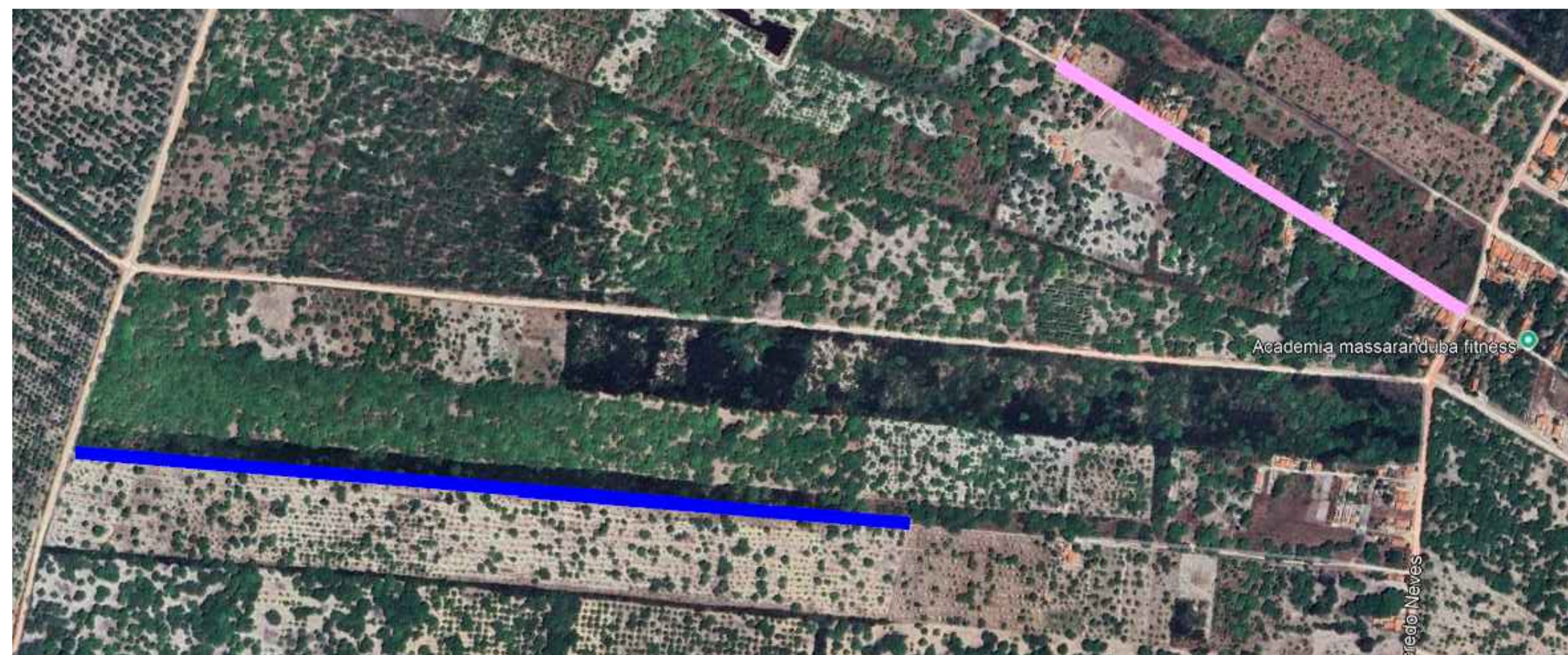
07 TRECHOS MASSARANDUBA EXTENSÃO ——— 989 M TRECHO 01 563 M TRECHO 02