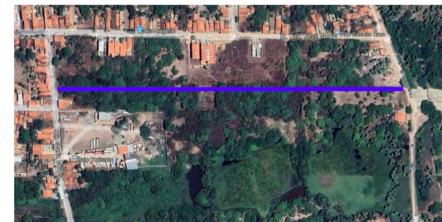
08 TRECHO MARIA MUNIZ – CELSO PATRICIO EXTENSÃO ——— 541 M