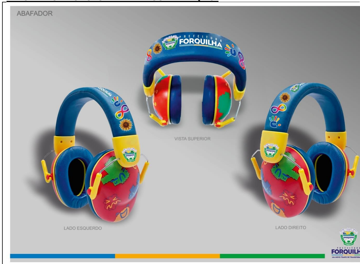
IMAGEM DO PRODUTO PARA PERSONALIZAÇÃO: