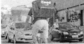
IFOOD foi fundado em 2011