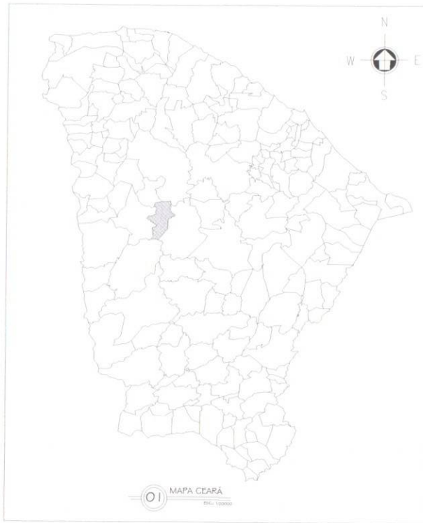
01 MAPA CEARÁ Escala 1:100.000