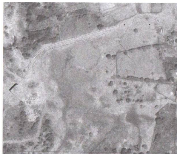
04 LOCALIZAÇÃO DA BARRAGEM Escala 1:10.000