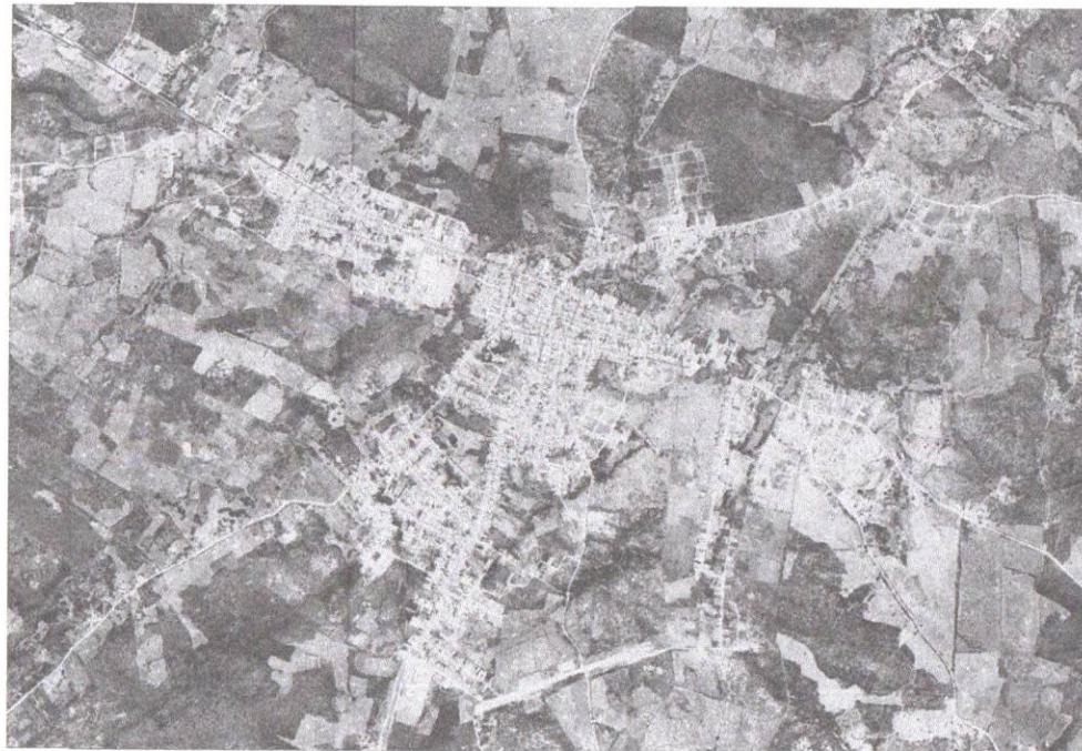
02 LOCALIZAÇÃO MONSENHOR TABOSA Escala 1:10.000