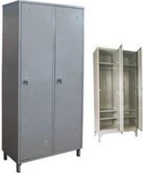
imagem 2, demonstrativo de maçaneta com chaves: