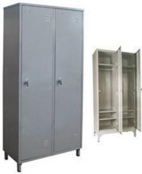
imagem 2, demonstrativo de maçaneta com chaves: