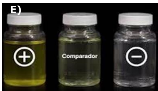
Figura 1. Cartela com substrato cromogênico definido CPRG/MUG (a,b,c) para contagem de coliformes totais e E.coli (metodologia proposta e comparação entre o substrato proposto esquerda e metodologia atual (d). Comparador com metodologia atual (e).

A nova metodologia evita falso positivo e incerteza na avaliação dos resultados.