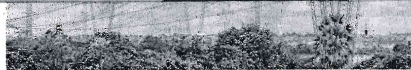
FALTA de infraestrutura para escoar energia é um dos gargalos encontrados em países cujo crescimento da energia renovável se deu de forma acelerada

Isso quer dizer que os valores para importação do maquinário variam, mas passam essencialmente por três categorias. As baterias em si são categorizadas como blocos DC, mas é também preciso de eletrocentros, que fazem a conversão da eletricidade para ser armazenada, e linhas de conexão. Cada um conta com regime tributário distinto, como esclarece Markus Vlasits,