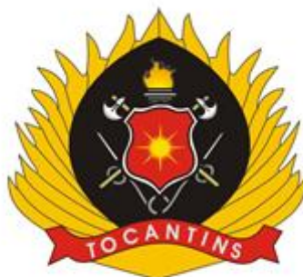
Florão de Oficial

É composto da insígnia-base, que parte de uma figura geométrica (escudo medieval) na cor vermelha, circundada por um friso, de 1,5mm, na cor preta, e na parte central do escudo, na cor amarelo-ouro, um sol estilizado, com 08 (oito) pontas maiores e 16 (dezesesseis) pontas menores, com (quatro) e 2,3 (dois e três décimos) módulo de raio. Sob o escudo, na posição central e vertical, existe um archote na cor marrom-madeira, de onde parte uma figura simbolizando as chamas, na cor laranja-fogo. Compõe-se, ainda, de duas machadinhas cruzadas, com cabos na cor marrom-madeira, tendo comprimento de 43mm e espessura de 1,5mm, as quais se cruzam a 120°. Na parte inferior da insígnia-base, destaca-se uma mangueira na cor prateada, que circunda a parte inferior do archote e das machadinhas. A mangueira tem, nas extremidades, dois esguichos agulhetas na cor prateada. A figura resultante desses elementos é contornada por uma forma aproximada de elipse, na cor preta, tendo em sua base um listel vermelho, onde é aplicada a inscrição, na cor prateada: "TOCANTINS", envoltas por molduras de chamas, na cor ouro. Tamanho total da peça: