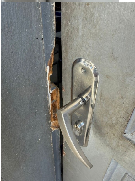
FECHADURA A SER UTILIZADA