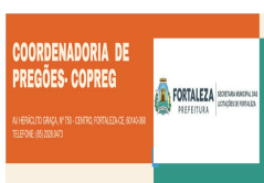
WhatsApp Image 2025-05-29 at 16.22.56.jpeg 76 KB