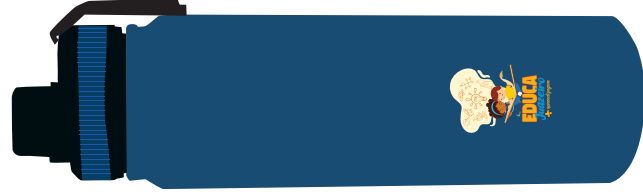
Garrafa térmica 500ml