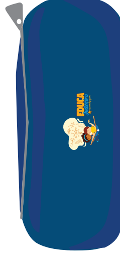
Estojo escolar simples, com zíper