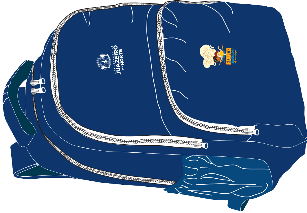
Mochila com alça alcochoada e bolsos laterais