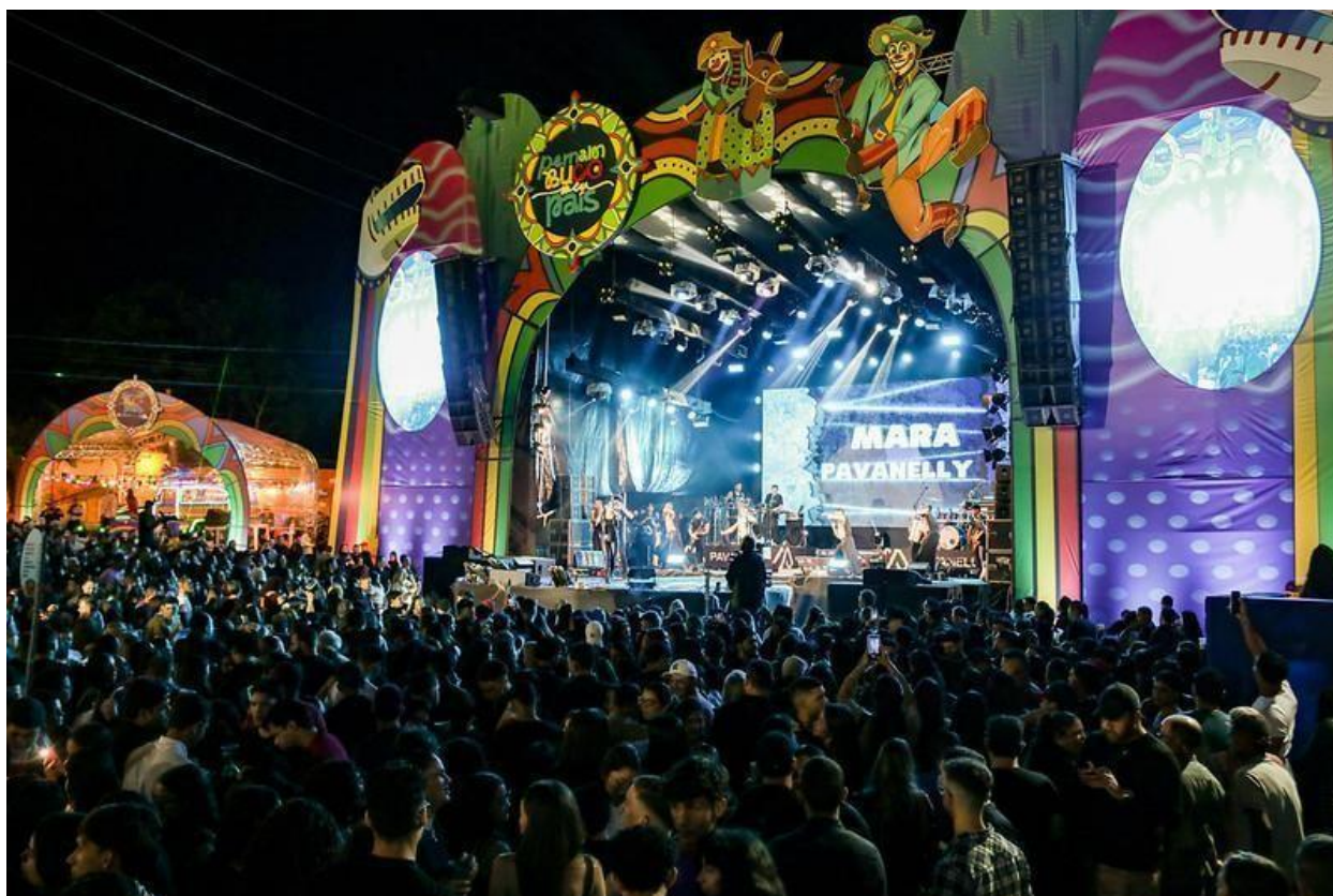
Imagem 10: Show no palco Pernambuco Meu País - Gravatá (2025). Foto: Eduardo Cunha/Secult-PE.

O Festival Pernambuco Meu País (FPMP) é um dos projetos realizados pela FUNDARPE mais bem sucedidos e implementados no ano de 2024, que apresentou uma proposta de programação cultural itinerante, proporcionando a interligação de curadoria, formação e patrimônio através de uma programação diversa e pensada estrategicamente para cada município onde foi realizado. Na sua programação foram incluídas as linguagens artísticas nos segmentos da Música, Cultura Popular, Audiovisual, Artes Visuais, Artes Urbanas/Artes Periféricas, Artesanato, Circo, Dança, Fotografia, Literatura, Design e Moda, Teatro, Patrimônio e Gastronomia, além de proporcionar uma programação especial e inédita voltada para o público infantil.