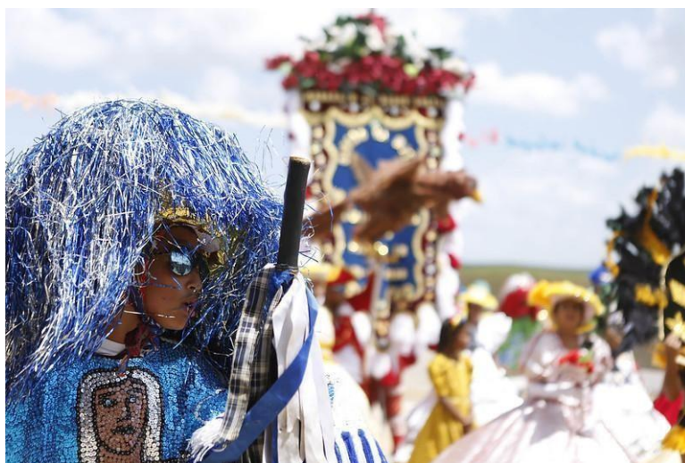
Imagens 1 e 2: Card de divulgação da Convocatória CAJU 2026 e Maracatu Leão do Norte, em Aliança-PE, no Ciclo Carnavalesco.

Para o Ciclo das Paixões 2026, foi lançado o Edital de Chamamento para seleção e premiação de propostas culturais destinadas à realização do 17º Pernambuco de Todas as Paixões, que tem como objetivo selecionar e apoiar projetos culturais de espetáculos cênicos que celebrem histórias e tradições cristãs, dialogando com o imaginário da Paixão de Cristo e das manifestações populares do Ciclo das Paixões. Com a seleção de propostas inovadoras e de qualidade, tendo em vista que a seleção prioriza espetáculos que unem tradição e criação artística, o Chamamento busca expandir a presença de espetáculos teatrais em diversos municípios pernambucanos; possibilitando que a população tenha acesso a apresentações artísticas que valorizam o patrimônio cultural e a religiosidade local.