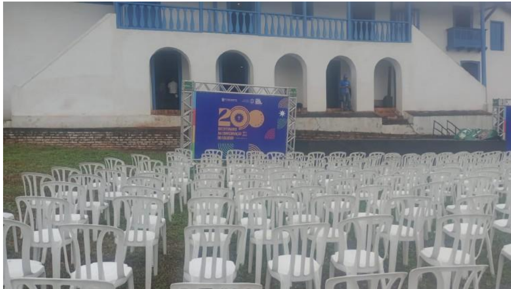
Imagem 20: Ação “200 anos do Bicentenário da Confederação do Equador”, em Vicência (2025).

Entre as demandas elencadas por esta Diretoria, foram considerados como necessidades, os seguintes tipos de assentos, conforme especificado na Tabela 01: