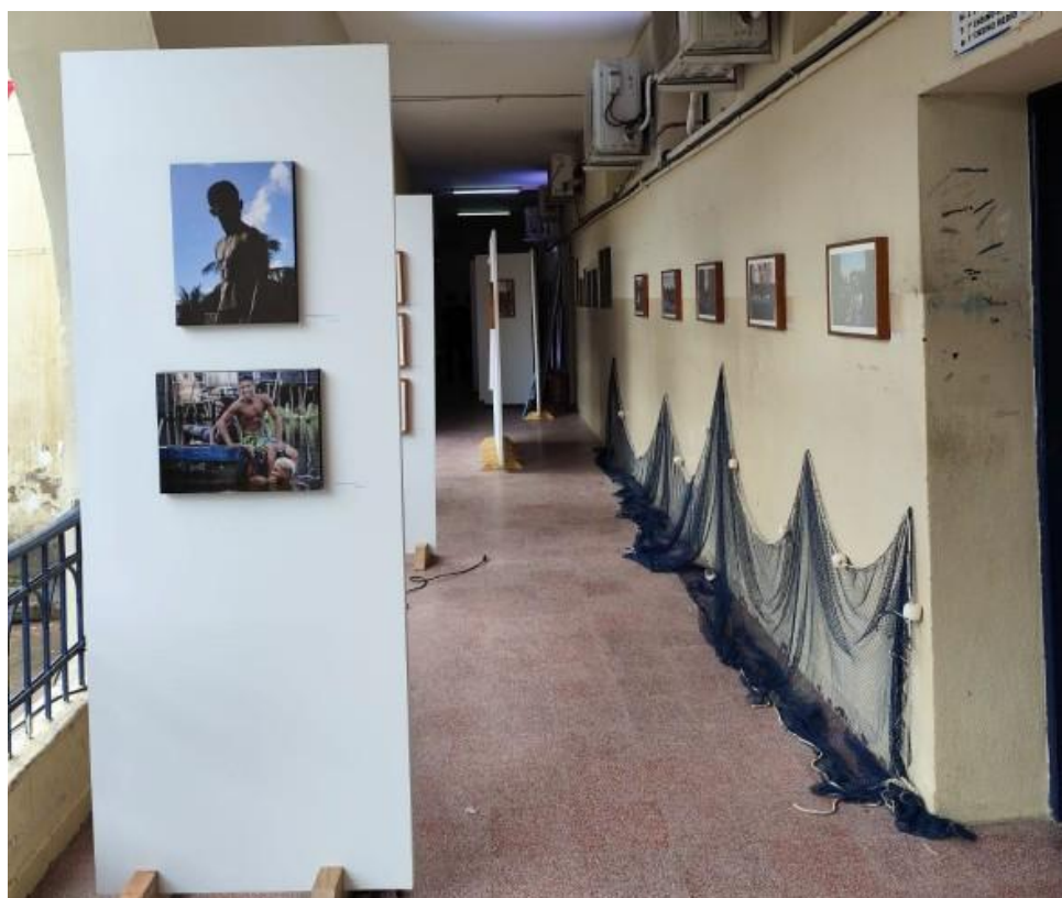
Imagem 25: Festival Pernambuco Meu País, em Pesqueira (2025).

Tais itens são comumente utilizados em ocasiões especiais, como por exemplo em aberturas solenes (entrega de Títulos e honrarias, inaugurações, entre outros), Palestras, Conferências, Seminários, Simpósios, Audiências públicas, Exposições, comemoração de datas alusivas e significativas, bem como para serem mobiliário de apoio nos ambientes como sala de imprensa, na ocasião de coletivas oficiais.