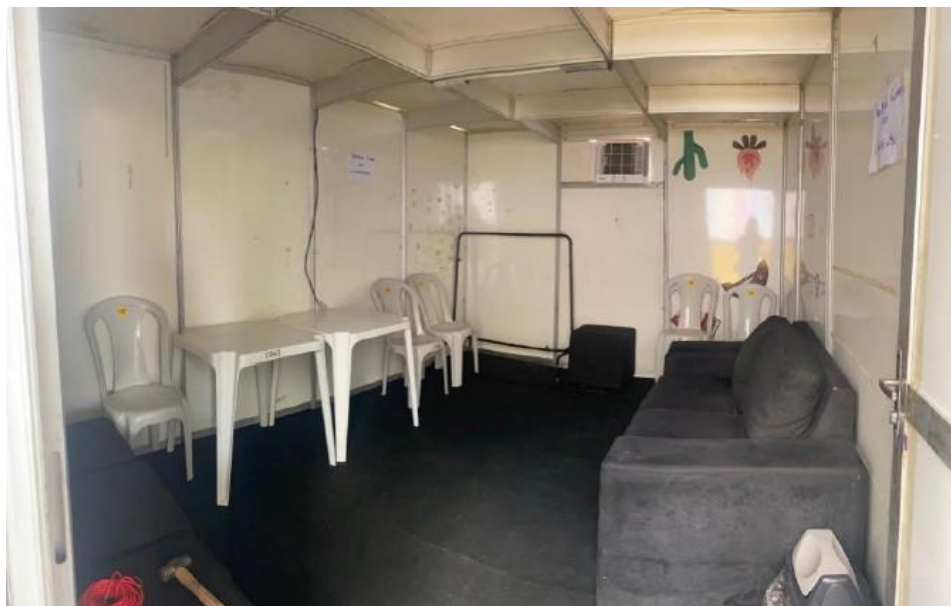
Imagem 21: Festival Pernambuco Meu País, em Pesqueira (2025).