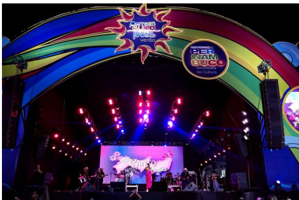
Imagem 14: FPMP Verão-Camaragibe (2025).