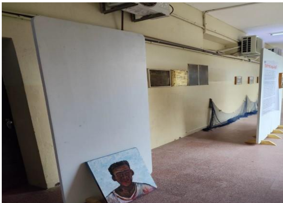
Imagem 26: Festival Pernambuco Meu País, em Pesqueira (2025).

Entre as demandas elencadas por esta Diretoria, foram consideradas como necessidades os seguintes tipos de acessórios do tipo utilitários, conforme especificado na Tabela 01: