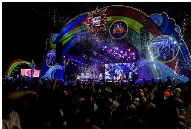
Imagem 15: FPMP Verão-Recife (2025).

Outras perspectivas de atuação, elencadas por esta Diretoria, dizem respeito à continuidade de projetos que tiveram início em 2024, como o Projeto “Saberes Carnavalizados”, que é executado em parceria com a Secretaria de Educação de Pernambuco e o Projeto “Cortejos Brincantes”, que acontece no âmbito do FPMP, dos ciclos tradicionais e do Festival REC'n'Play. Ademais, é fundamental considerar também a diversidade das ações, apoios realizados e eventos que já tem a atuação direta ou indireta da FUNDARPE, a exemplo dos eventos abaixo elencados: