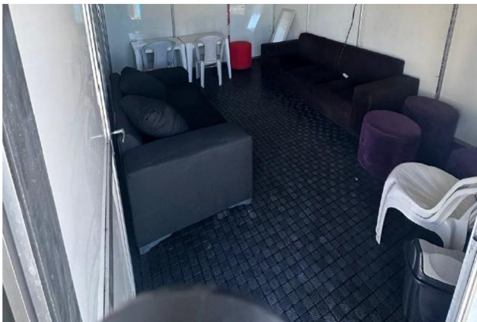
Imagem 19: Festival Pernambuco Meu País, em Salgueiro (2025).