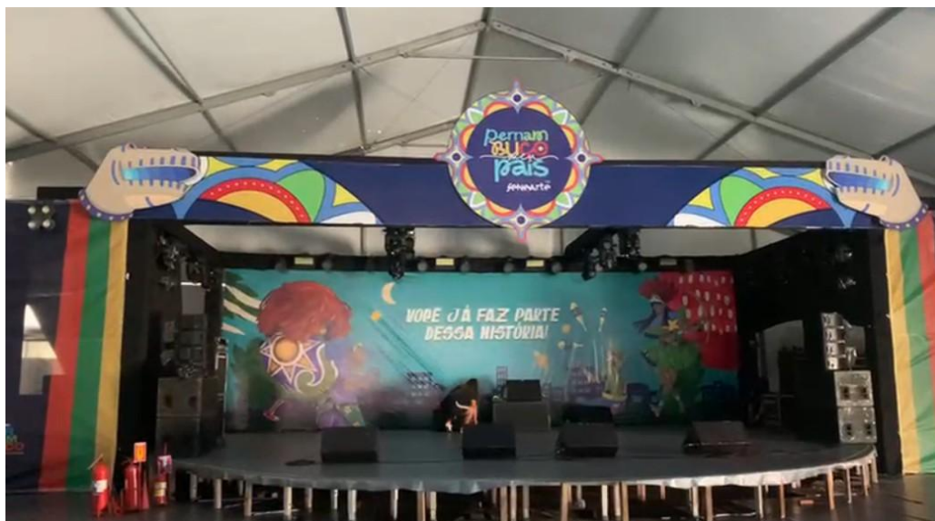
Imagem 7: Montagem do Palco Pernambuco Meu País.