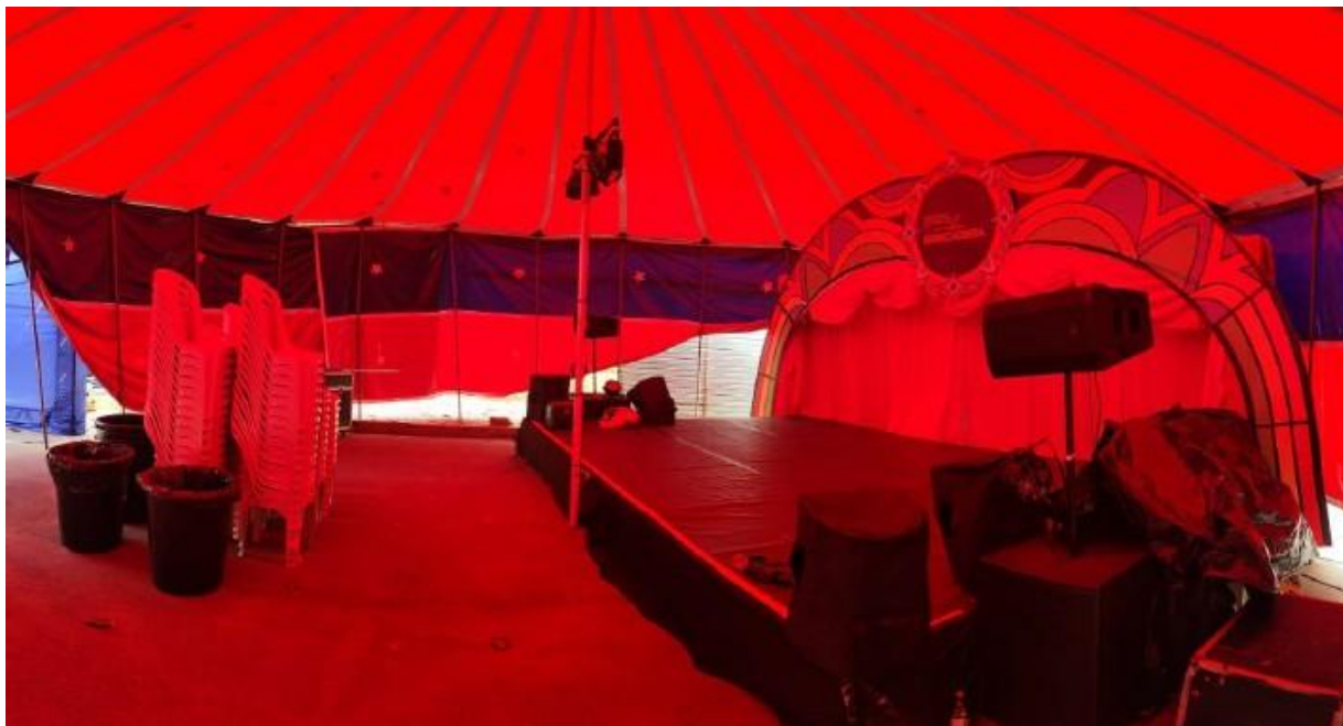
Imagem 23: Festival Pernambuco Meu País, em Pesqueira (2025).