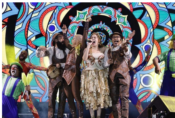
Imagem 12: Espetáculo Acroshow, FPMP-Gravatá (2025).