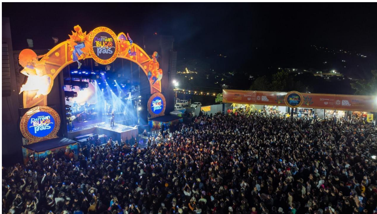
Imagem 11: Show Jorge Vercilo, Jul 2024.

(SECULT-PE) e Empresa Pernambucana de Turismo (EMPETUR), movimentando 93% da rede hoteleira em 24 dias de festival.