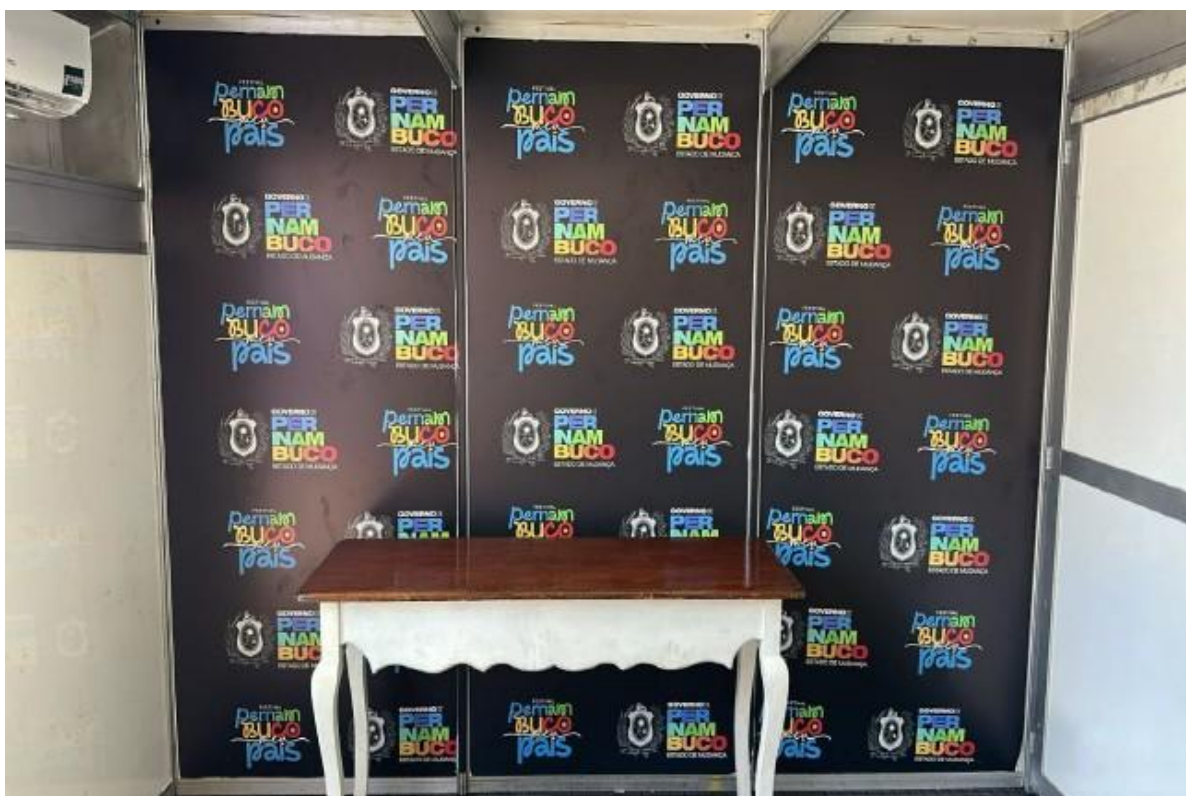
Imagem 16: Festival Pernambuco Meu País, em Salgueiro (2025).