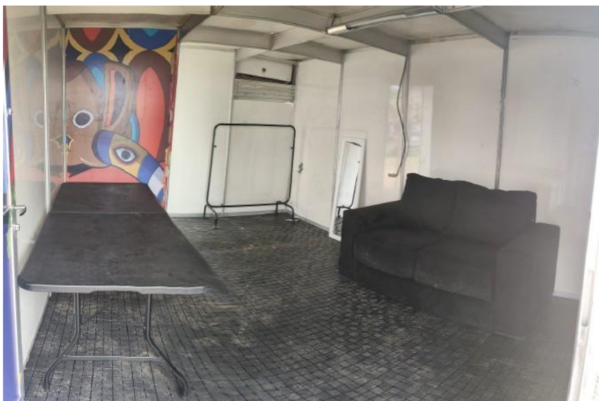
Imagem 17: Festival Pernambuco Meu País, em Bezerros (2025).