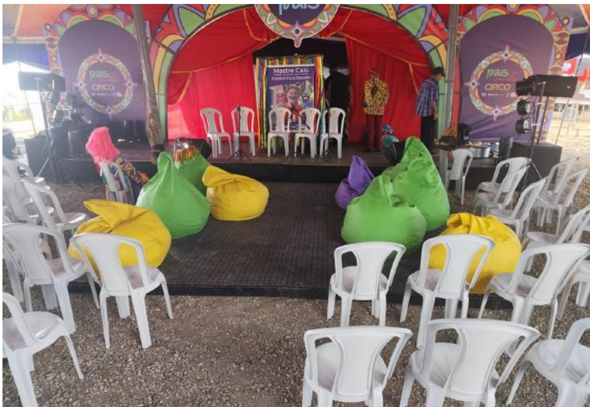
Imagem 18: Festival Pernambuco Meu País, em Bezerros (2025).

Os assentos podem ter diferentes formatos (assentos com bases fixas ou assentos giratórios, dimensões e materiais constituintes na sua fabricação (assentos com bases metálicas ou em madeira, assentos em madeira, assentos em material sintético e assentos de materiais plásticos, por exemplo).