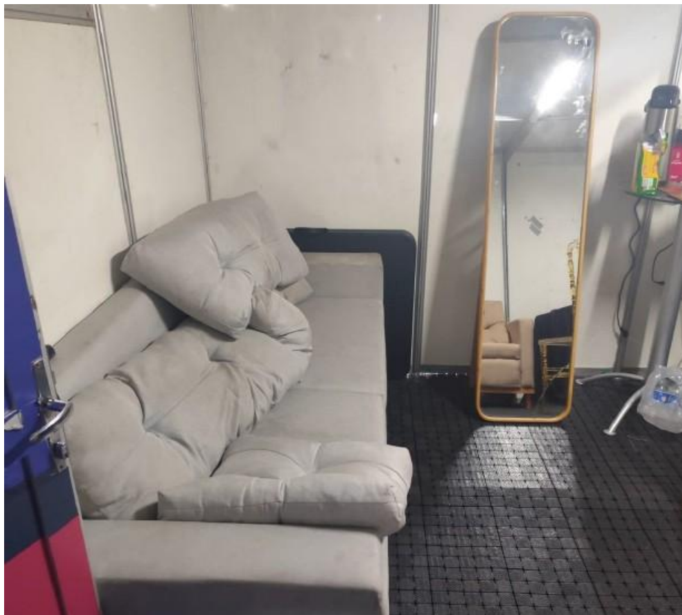
Imagem 22: Festival Pernambuco Meu País, em Búique (2025).