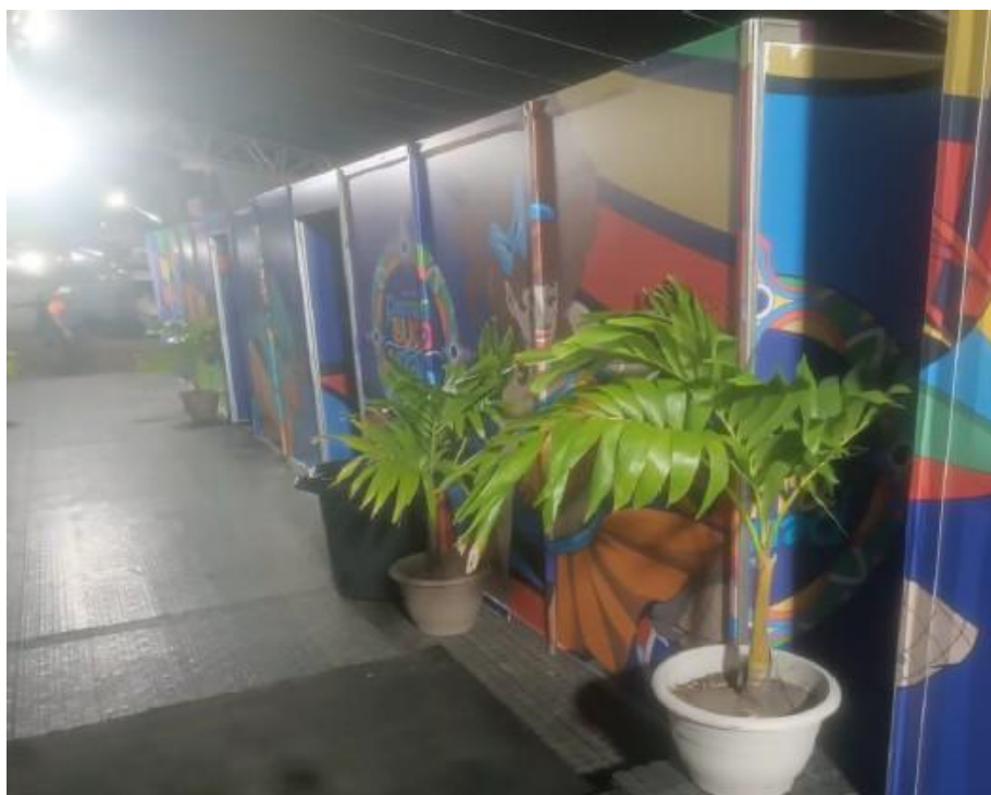
Imagem 24: Festival Pernambuco Meu País, em Pesqueira (2025).

Tais itens são comumente utilizados em ocasiões especiais, como por exemplo em abertura de exposições, sessões solenes (entrega de Títulos e honrarias), Palestras, Conferências, Seminários, Simpósios, Audiências públicas, comemoração de datas alusivas e significativas, bem como para decorar ambientes como camarins de artistas, salas de chefes de Estado ou sala de imprensa, na ocasião de coletivas oficiais.