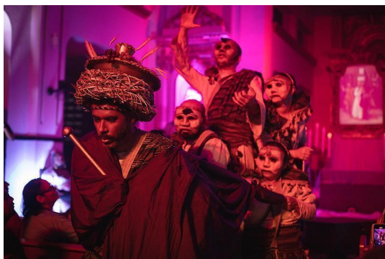
Imagens 3 e 4: Card de divulgação do Edital do 17º Pernambuco de Todas as Paixões 2026 e registro do “Auto da Via Dolorosa”, realizado em Timbaúba-PE, 2024.